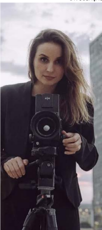
Diretora acompanha pastor Silas Malafaia em filme

O documentário também revisita a relação de Malafaia com Jair Bolsonaro, mostrando o pastor como figura central na articulação ideológica e no discurso absolutista que marcou o período. Ao longo da narrativa, o filme percorre o ambiente eleitoral, a radicalização do discurso religioso e os acontecimentos que antecederam os ataques golpistas de 8 de janeiro.