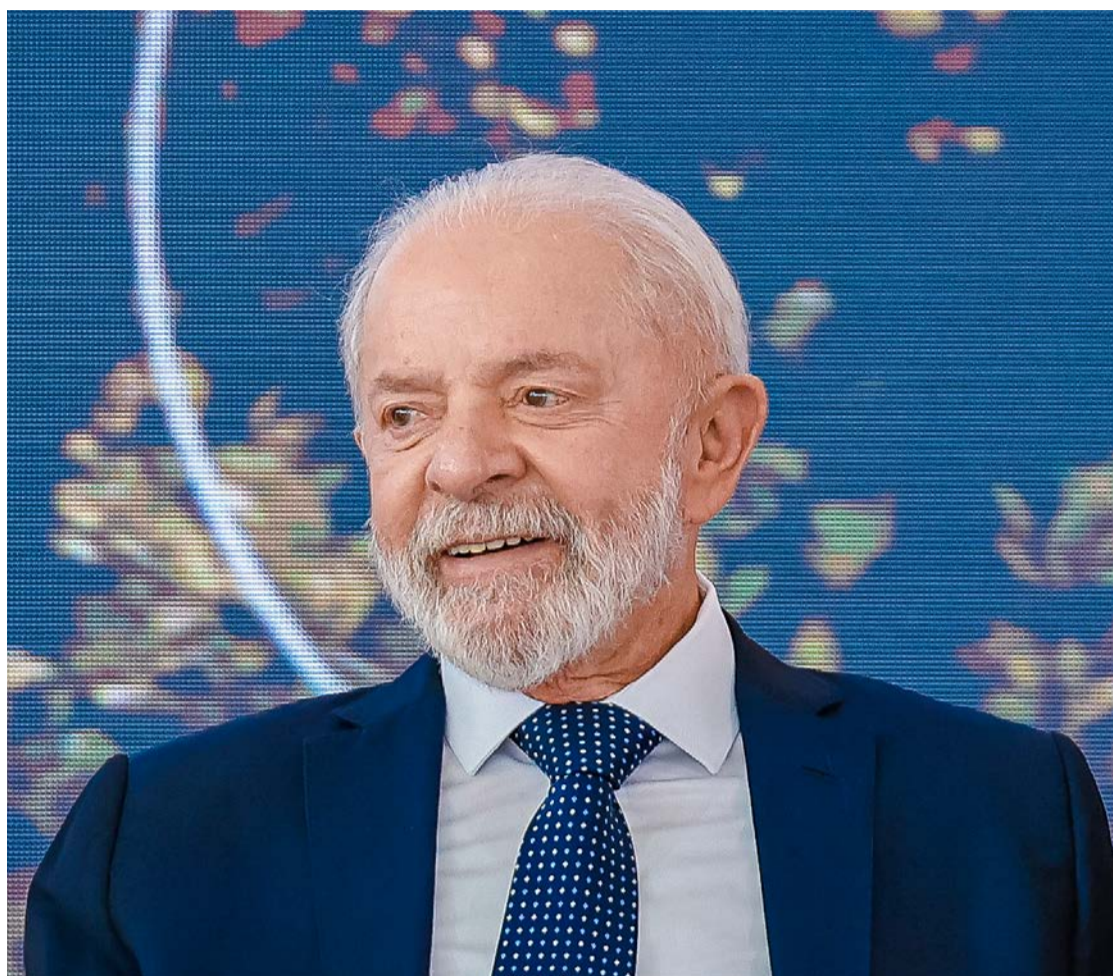
Presidente Lula comemora a decisão da Europa e fechar acordo com o Mercosul

O tratado quase foi assinado no final de dezembro, durante a cúpula do Mercosul em Foz do Iguaçu (PR). Mas o ato acabou adiado por causa de uma resistência de última hora da Itália, que daria à França o apoio necessário para bloquear a votação nas instâncias