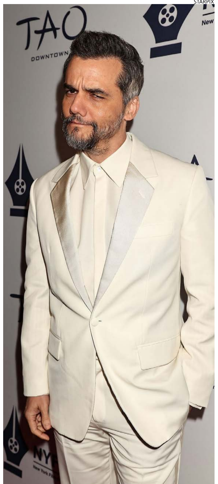
Wagner Moura aparece bem-cotado às vésperas de um dos prêmios mais importantes da indústria

Não muito tempo depois, conforme Mendonça Filho, já “chamávamos fascista de fascista”. “Na mídia-veneno brasileira, contrariar uma versão oficial é receita certa para ser chamado de ‘polêmico’. Um dia quero ser xingado de sensato”, ironiza o diretor, ao guiar o leitor pelo roteiro de “O Agente Secreto” — cuja obra chegou às livrarias pela editora Record.