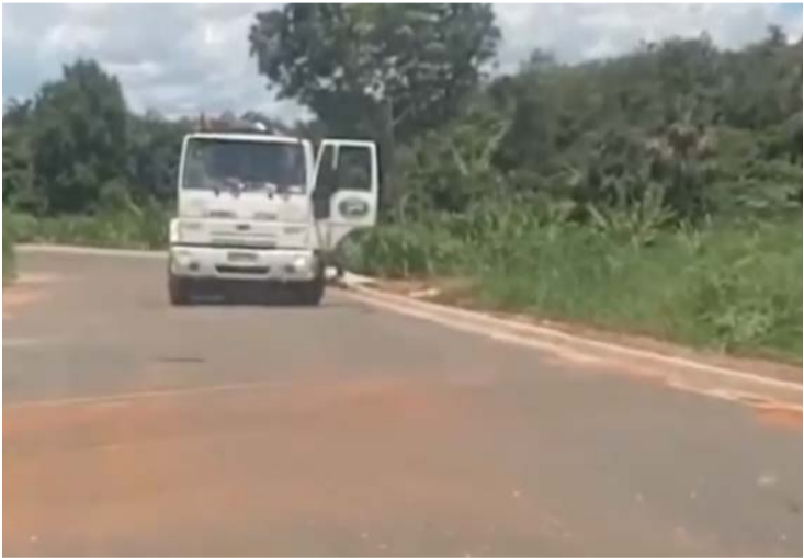
Prática irregular leva os resíduos diretamente aos córregos

O descarte irregular configura crime ambiental, sujeito a pesadas multas e responsabilização