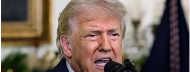
Donald Trump: "vamos fazer algo na Groenlândia, quer eles gostem ou não"

Governo Trump considera oferecer até US$ 100 mil por pessoa em estratégia para convencer população da ilha ártica a se separar da Dinamarca