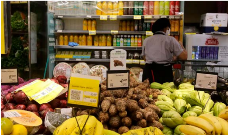
Inflação oficial registou uma subida de 0,33% em dezembro