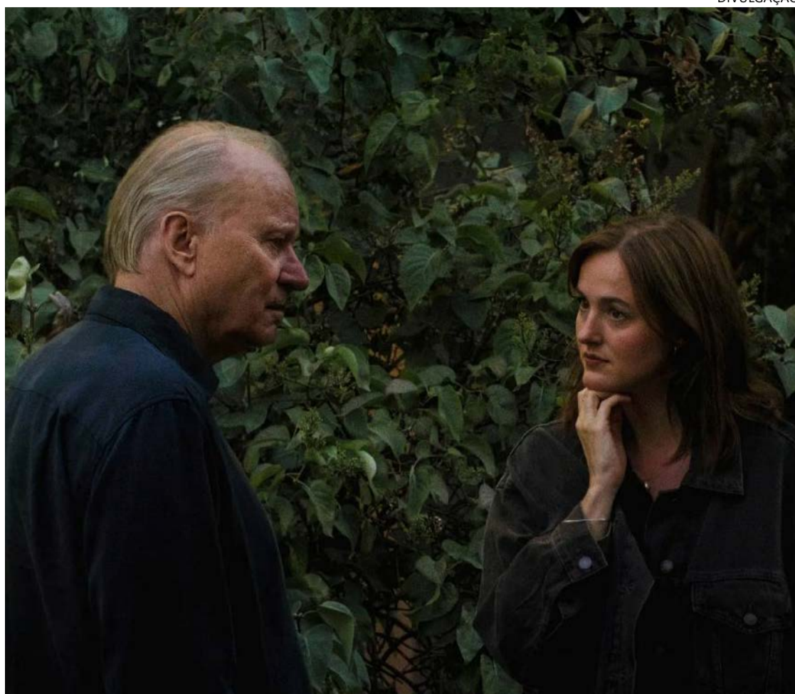
Voz narrativa interior: produção nórdica se revela bela ao abordar mente dos personagens

A incomunicabilidade, como se dizia no passado, impera. Gustav busca outra atriz para fazer o papel