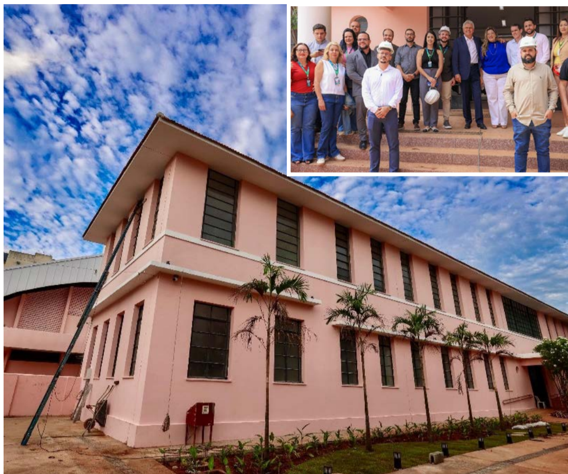
No detalhe, governador Ronaldo Caiado durante vistoria realizada na última sexta-feira, 9: "O que estamos fazendo hoje é uma restauração completa do prédio"

Para o governador, o projeto integra um conjunto mais amplo de políticas públicas que colocaram Goiás na liderança nacional em educação. Desde 2019, o Estado investiu cerca de R$ 9 bilhões na área. "Somos referência no Brasil. Goiás pode dizer de cabeça erguida: se qui-