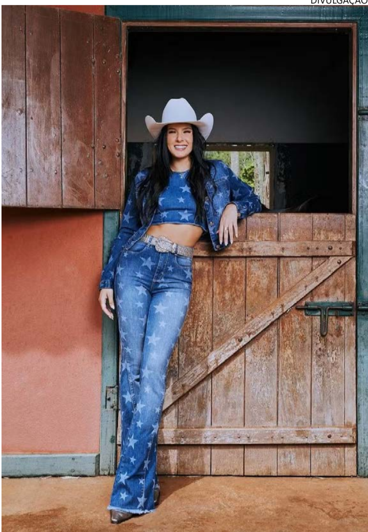
Ana Castela é um dos nomes confirmados para cantar durante Romaria do Divino Pai Eterno

Ao longo dos dez dias, estão previstas missas, novenas, procissões, vigílias e momentos de oração, tanto no Santuário quanto em outros pontos da cidade. Um dos momentos mais simbólicos será o tradicional Desfile de Carreiros, Boiadeiros e Muladeiros, marcado para 2 de julho, quando carros de boi, cavaleiros e muladeiros ocupam as ruas em uma demonstração de fé e preservação da cultura rural goiana.