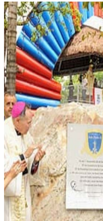
Cocar do 'Papa': Símbolo da visita papal ficou até pouco tempo instalado no Serra Dourada; hoje está no Campus 2 da PUC

O Diário da Manhã situou seus leitores no meio daquilo que chamou de "um dos maiores acontecimentos da história recente de Goiânia". Essa narrativa jornalística — ao lado da análise de Larissa Cotrim — contribui para um retrato mais completo de como aquele dia foi vivido tanto pelas instituições quanto pela comunidade católica local.