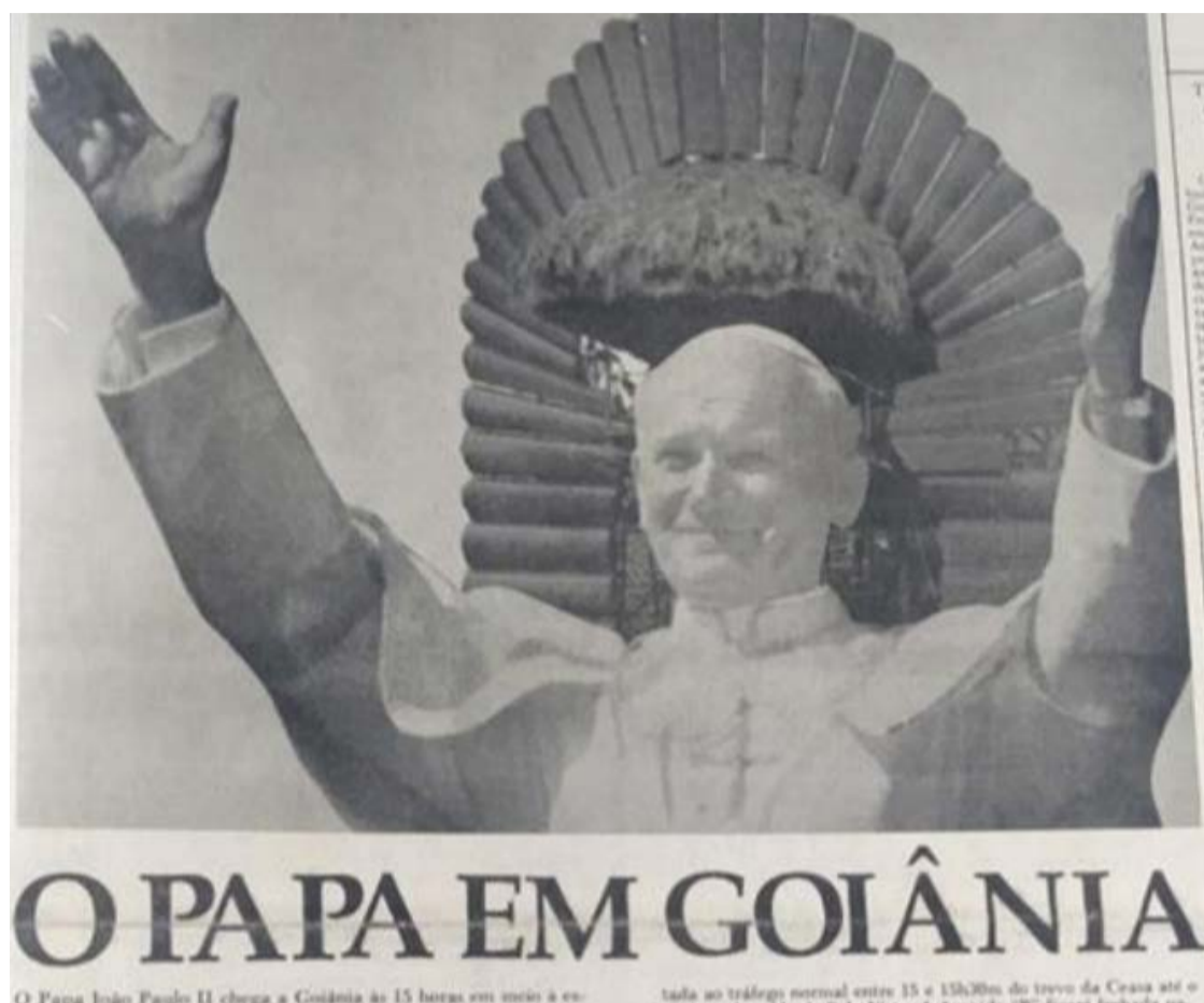
Visita de João Paulo II a Goiânia foi tema de amplas coberturas do Diário da Manhã na época: elogios e críticas

A imprensa local foi protagonista na construção da memória daquele dia histórico. O Diário da Manhã , um dos principais jornais de Goiânia em outubro de 1991, ofereceu cobertura detalhada da chegada de João Paulo II no Aeroporto Santa Genoveva, relatando que "a chegada do Papa João Paulo II ao pátio do Estádio Serra Dourada... aconteceu às 15h43", e descrevendo o momento como um dos mais aguardados pela população goiana.