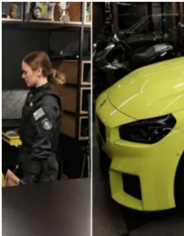
Construtora é investigada por irregularidades em contratos de obras residenciais

Neymar foi diagnosticado com uma lesão de grau 2 na panturrilha direita e, nos basti-