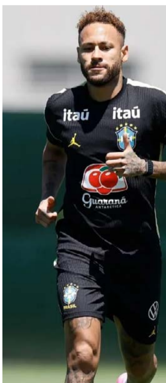
Nesta terça-feira (16), atacante participou de atividades no gramado

mou que as investigações continuam com análise de documentos apreendidos, oitivas e busca por novos envolvidos. O nome da operação, Opus Malus, faz referência à expressão "obra maldita", em alusão às irregularidades apuradas.