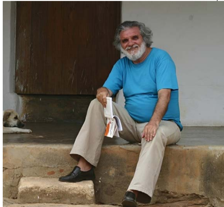
Pernambucano publicou seu primeiro livro nos anos 1970