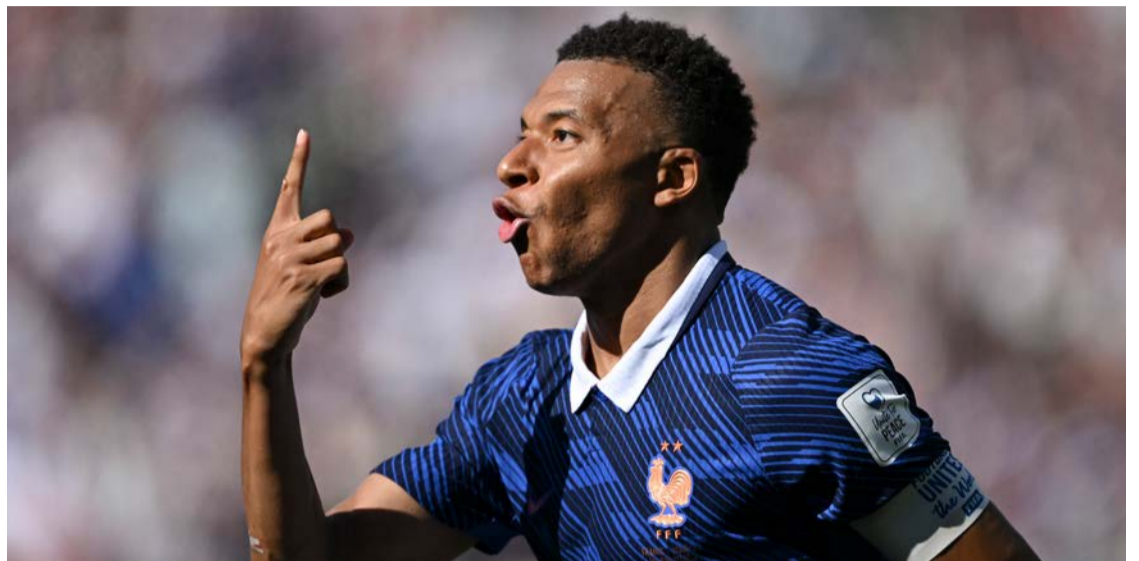
Com os gols anotados diante dos senegaleses, Mbappé chegou a 58, superando Olivier Giroud

Apesar do favoritismo, a França encontrou dificuldades durante os primeiros 45 minutos. Mesmo controlando a posse de bola, a equipe comandada por Didier Deschamps produziu pouco ofensivamente e não acertou nenhuma finalização no alvo. Senegal,