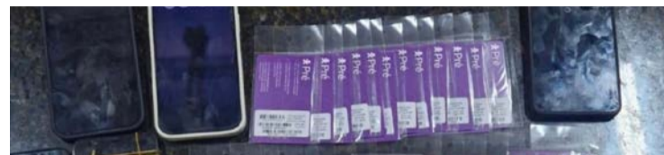
investigação apura a prática de estelionato eletrônico