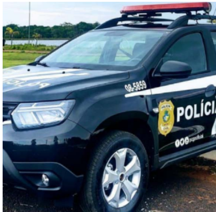
Suspeito deixou o Mato Grosso e passou a residir em Rio Verde (GO)

Equipes da Polícia Civil de Mato Grosso deslocaram-se até Goiás para efetuar a prisão