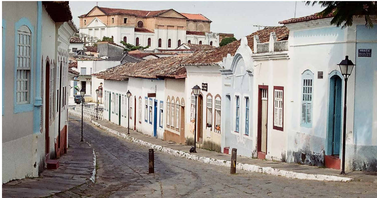
Tudo na faixa: antiga capital goiana abriga intensa e diversificada programação cultural até o fim de semana