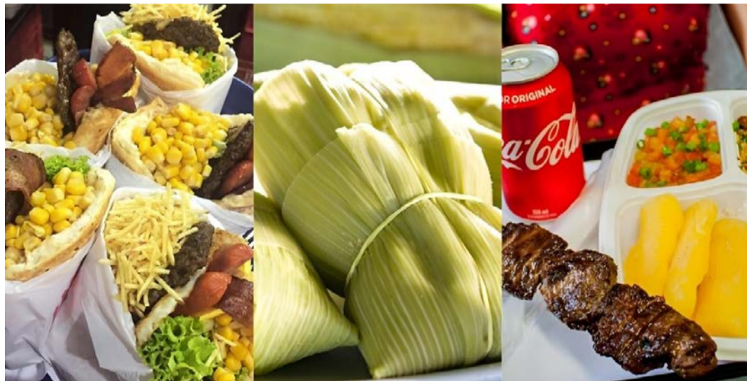
Identidade cultural: culinária popular na capital goiana alimenta e dá prazer

Goiânia não serve apenas pratos. Goiânia serve memória, acolhimento e pertencimento. Em cada esquina, existe um pedaço da identidade