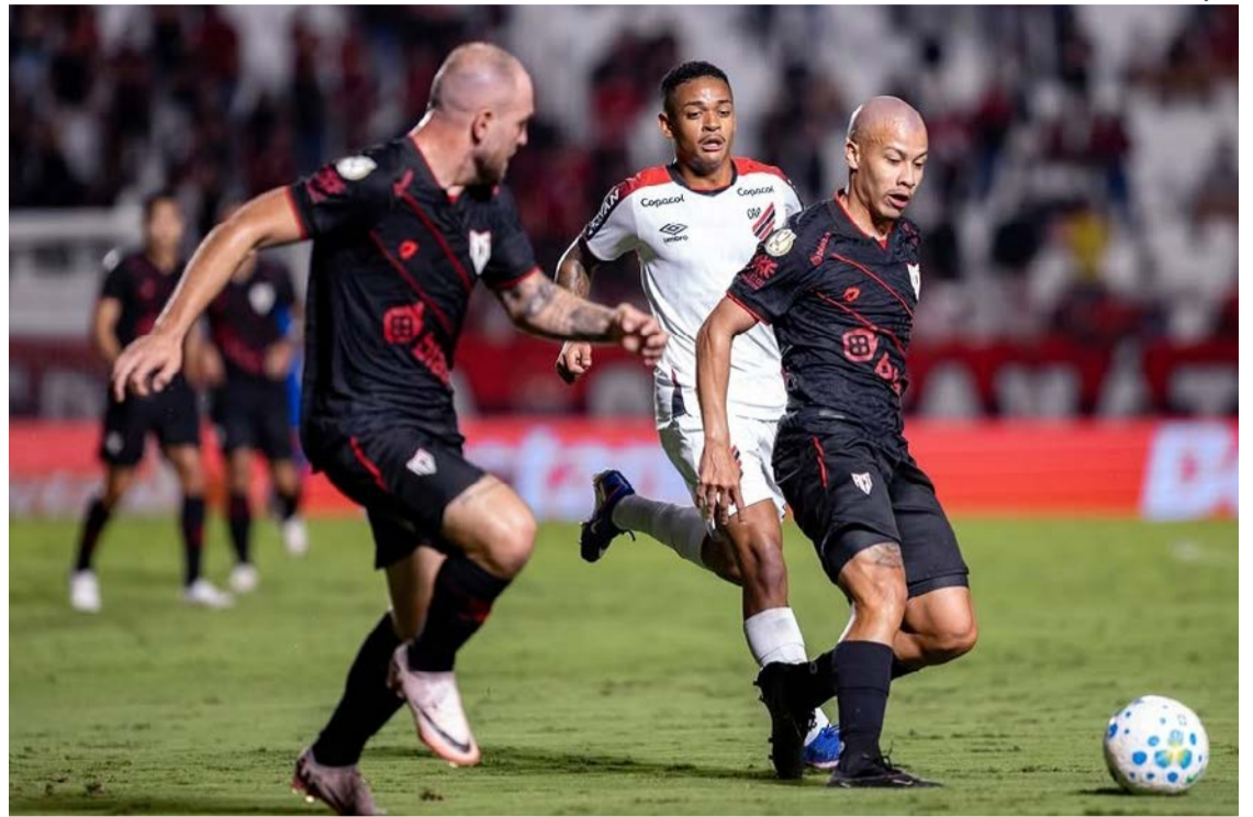
Atlético-GO desperdiça cobranças no Accioly e sofre eliminação para o Athletico-PR na Copa do Brasil