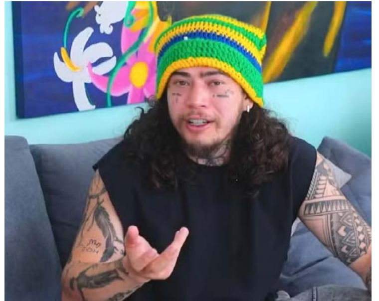
Humorista Whindersson Nunes, 31 anos: gastos com drogas