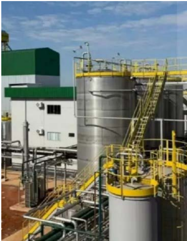
Redução ainda não chegou ao consumidor em Goiânia, onde os preços seguem acima da média nacional

vel despenca nas usinas, os preços praticados na capital goiana seguem entre os mais altos do país. Em estados como São Paulo, por exemplo, houve queda no varejo, com o etanol passando de R$ 4,52 para R$ 4,17 por litro no mesmo período. Em Mato Grosso, o valor recuou de R$ 4,64 para R$ 4,44.