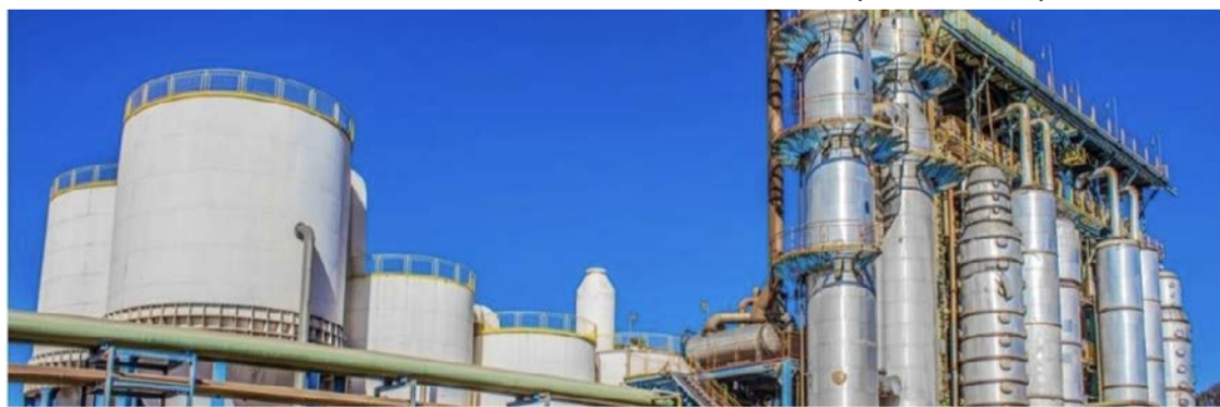
Produção industrial de Goiás cresce 3,6% em março: ambiente favorável à atração de investimentos

Impulsionada por setores como alimentos e farmacêuticos, produção de Goiás avançou 3,6% e ficou entre os melhores desempenhos do país