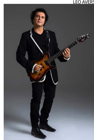
Frejat posa para ensaio com a guitarra N.Zaganin

Em 2017, o jornal "O Globo" surpreendeu os fãs ao noticiar: "Barão sem Frejat". Durante a pandemia, em 2020, lançou "Ao Redor do Precipício" e o show "Frejat em Blues", em que relê clássicos da MPB sob um viés blusey. Neste ano, retornou à antiga banda para a turnê "Encontro", que estreou no Rio em 30 de abril e chega a São Paulo no próximo sábado (23).