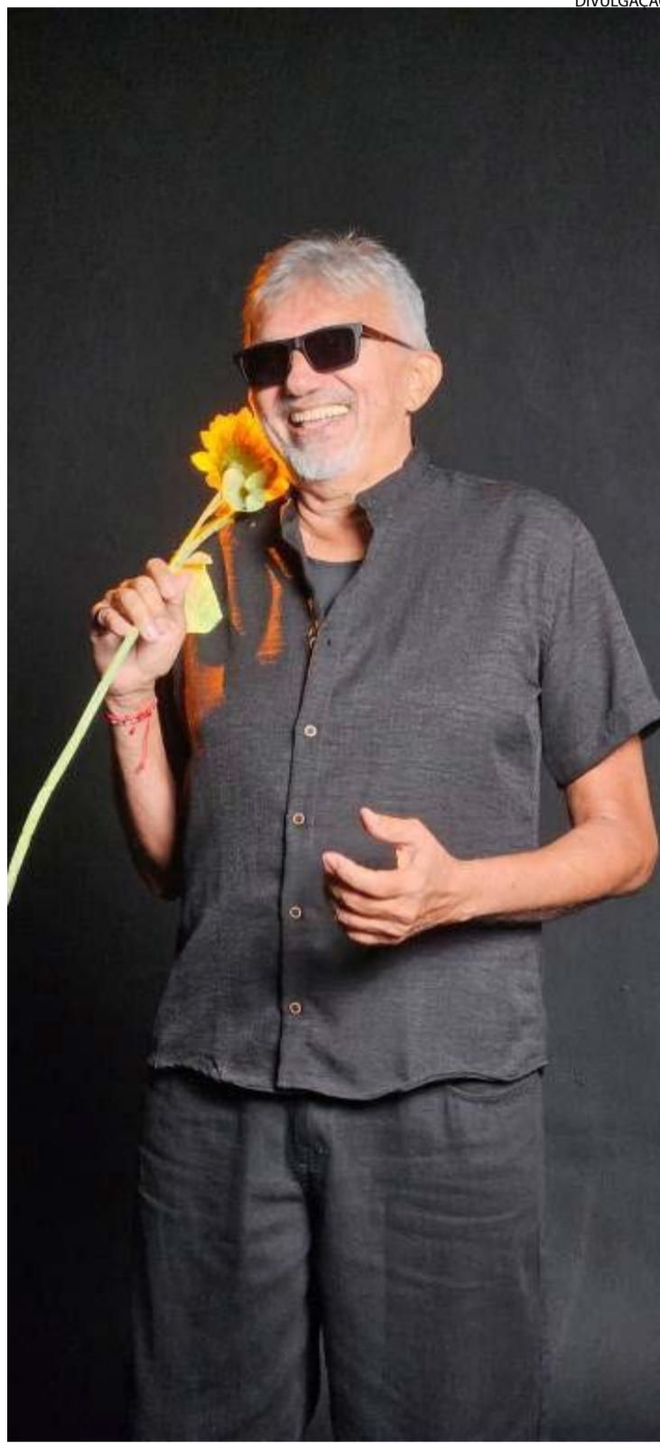
Novo tom: cearense apresenta repertório menos gozador

A conversa acabou entrando, então, no avanço das inteligências artificiais capazes de simular vozes de artistas mortos. Rick rejeita a ideia de reconstruir os Mamonas digitalmente. "Tudo que a inteligência artificial faz hoje é muito clichê, muito sem graça, muito óbvio", afirma. "Quando pensei nessa música, pensei em tocar os instrumentos como os meninos tocariam hoje."