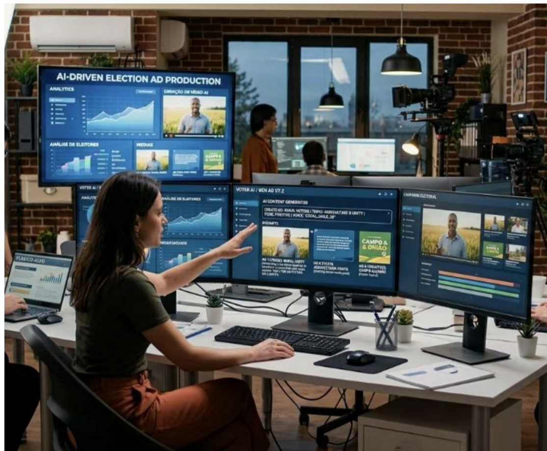
Imagem criada por IA: campanha terá uso de inteligência artificial para diversos propósitos

vantamento são coletados por meio de pesquisas, porém não são pesquisas eleitorais. Segundo Porfírio, os dados são de compreensão da sociedade, e essas pesquisas vão abastecer a ferramenta para entender o que o eleitor final busca e assim conseguir alinhar o discurso do candidato para aquele determinado público.