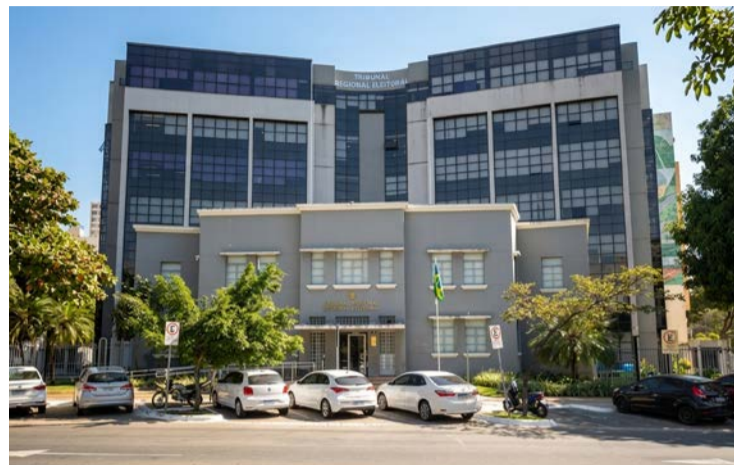
Fachada da Justiça Eleitoral em Goiânia: PT pode perder vereadores

Federação teria registrado algumas candidatas apenas para cumprir o percentual mínimo de 30%