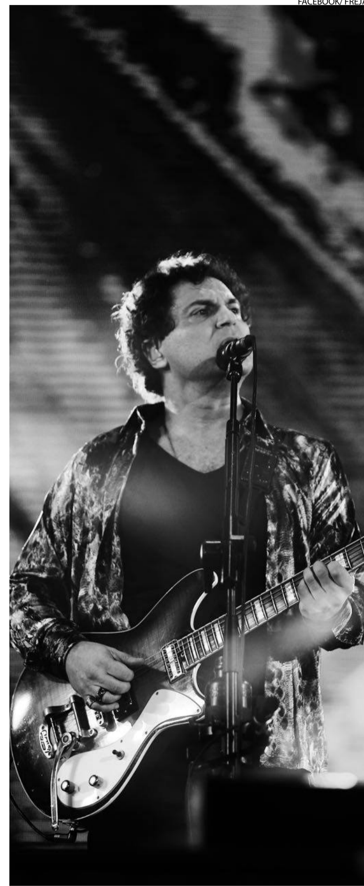
Roberto Frejat durante o Réveillon de Copacabana, no Rio, em 2017

Lançados o álbum de 2004 e o "MTV Ao Vivo", de 2005, o guitarrista pegou a estrada para mostrar ao público brasileiro o repertório acoplado no primeiro DVD do Barão. Apenas hits. Regressou à carreira individual em 2007 e, no ano seguinte, saiu o CD "Intimidade entre Estranhos", no qual o artista