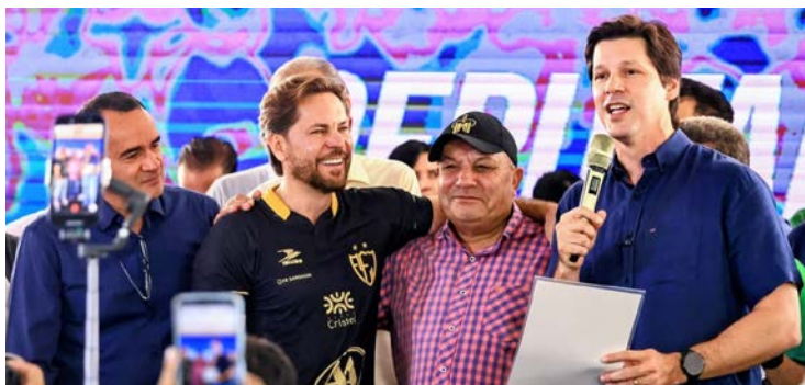
Vice-governador enfatizou que investimentos estaduais têm chegado de forma contínua às regiões do interior

"O nosso governo tem investido bastante em todas as regiões do Estado, em especial na Sudoeste. São investimentos em infraestrutura, como rodovias, na saúde, educação