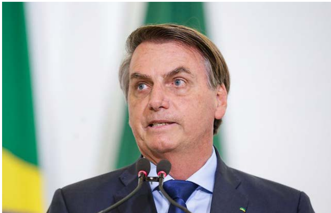
Presidente Bolsonaro continua preso na Papudinha em Brasília por tentativa de golpe de estado

é que Bolsonaro representa um risco ao Estado na medida em que, caso sofra um acidente grave ou até morra na prisão, o ônus recairia sobre o Supremo. Esses mesmos bolsonaristas minimizam o risco de fuga do ex-presidente caso ele volte para casa, a partir de uma avaliação de que a tentativa de rompimento da tornozeleira em novembro teria sido resultado de um surto.