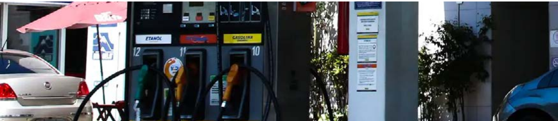
Nos postos, o valor médio disparou 37,1%, de R$ 4,98 para R$ 6,33 por litro