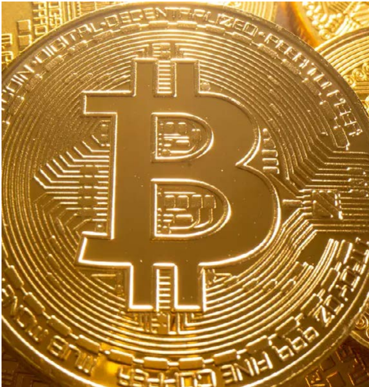
Apesar da queda recente, especialistas lembram que oscilações bruscas fazem parte do histórico do Bitcoin

Segundo analistas, o cenário é resultado de diversos fatores combinados, como incertezas na economia global, menor interesse por ativos de maior risco e vendas realizadas por grandes investidores. As liquidações em massa no mercado de derivativos também contribuíram