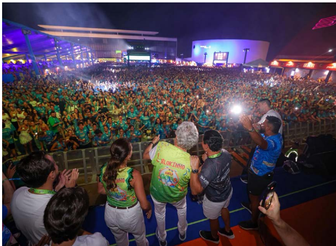
Governador Ronaldo Caiado prestigiou, na noite de sábado (7/2), a edição 2026 do Circuito Folia Goiás, realizado na Avenida 85, em Goiânia

Entre as atrações musicais, o goiano DJ Múcio foi o responsável por abrir os trabalhos. Juntaram-se a ele o carioca Dennis DJ e a dupla sertaneja paulista Guilherme & Benuto, além da grande estrela do evento: o cantor baiano Léo Santana. "Goiás e Goiânia são lugares onde o sertanejo predomina, mas são muito ecléticos.