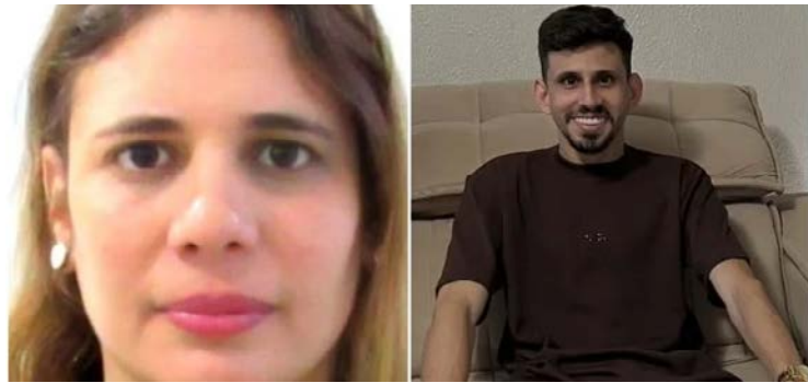
Estudante pediu um abraço à professora e a esfaqueou quando ela se aproximou