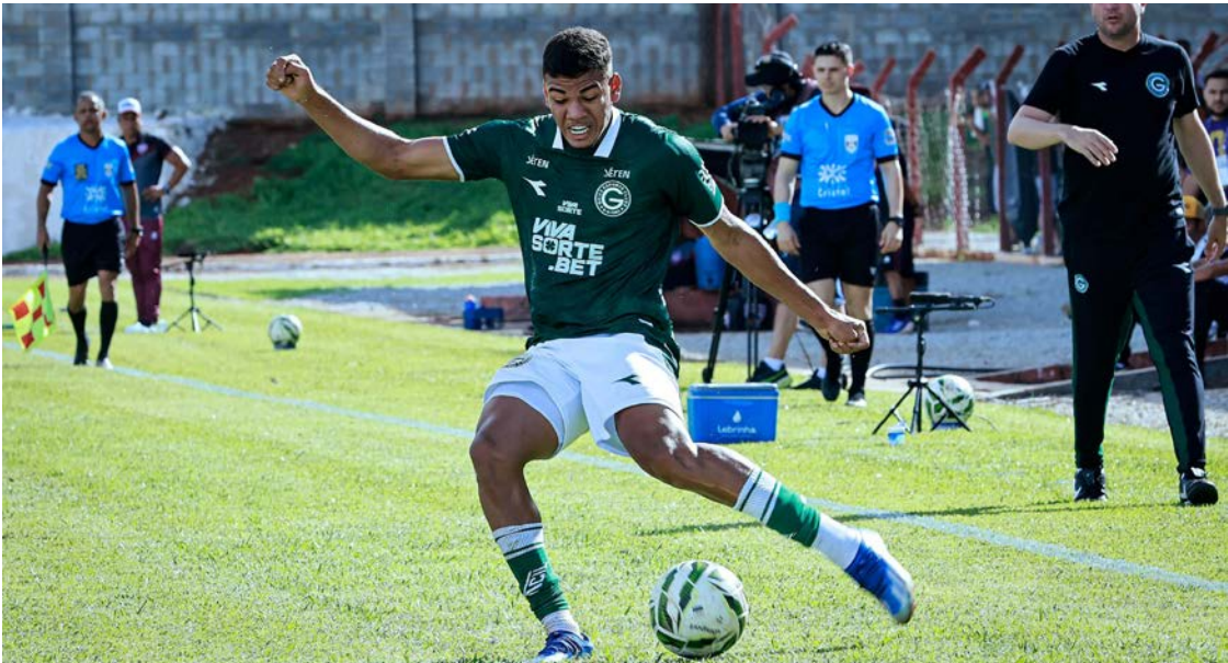
Goiás apresentou dificuldades na etapa inicial com a equipe reserva, mas venceu o Inhumas por 1 a 0