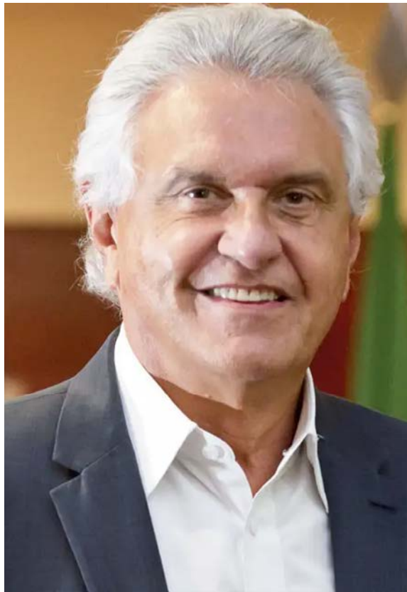
Ronaldo Caiado: comando do PSD

O senador, no entanto, defende seu projeto e garante que seu nome tem viabilidade para estar no pleito deste ano pelo atual partido, o PSD. “Se eu não tivesse apoio, eu seria o primeiro a chegar pra vocês e à população do estado de Goiás e dizer ‘Não pretendo disputar a reeleição porque não sou viável’. Mas hoje, sou viável e pretendemos disputar novamente o cargo de senador da República”, afirmou Cardoso, em entrevista coletiva sexta-feira (6/02),