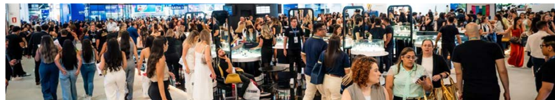
Renova participa do CIOSP, em São Paulo, e anuncia lançamentos voltados à integração entre estética, saúde e inovação digital