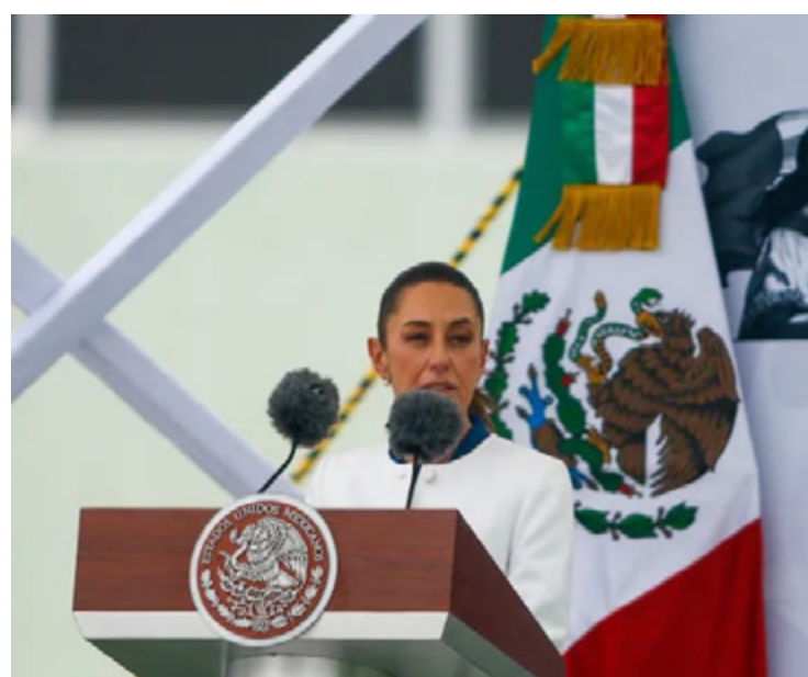
Claudia Sheinbaum: escalada nas tensões diplomáticas entre México e Estados Unidos

Em uma medida relacionada, Sheinbaum anunciou a expansão de uma ação judicial contra fabricantes de armas americanos. O governo mexicano acusa essas empresas de vender armas aos cartéis, contribuindo para a violência relacionada ao narcotráfico no país.