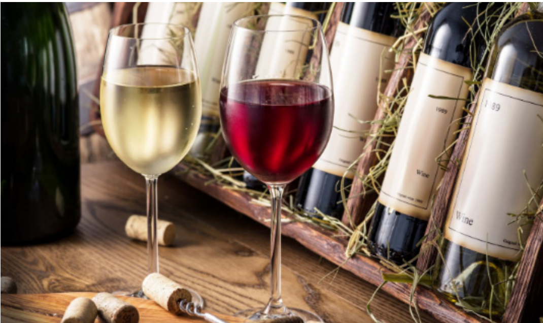
Eles não apenas nos aquecem o corpo, mas envolvem nossa alma

Há aqueles que nos acolhem, que seguram nossas mãos nos dias de incerteza e que celebram ao nosso lado quando a vida sorri