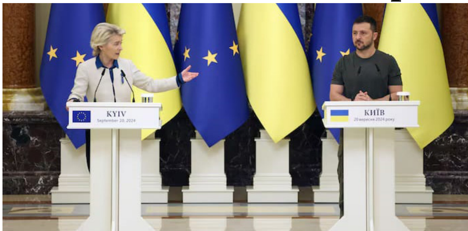
Presidente da Comissão Europeia Ursula von der Leyen e o presidente ucraniano Volodymyr Zelensky

Donald Trump, em sua plataforma Truth Social, referiu-se a Zelensky como um "ditador sem eleições", instando-o a "se apressar ou não lhe restará país". Essa declaração provocou uma reação imediata da UE, que defendeu a legitimidade do governo ucraniano.