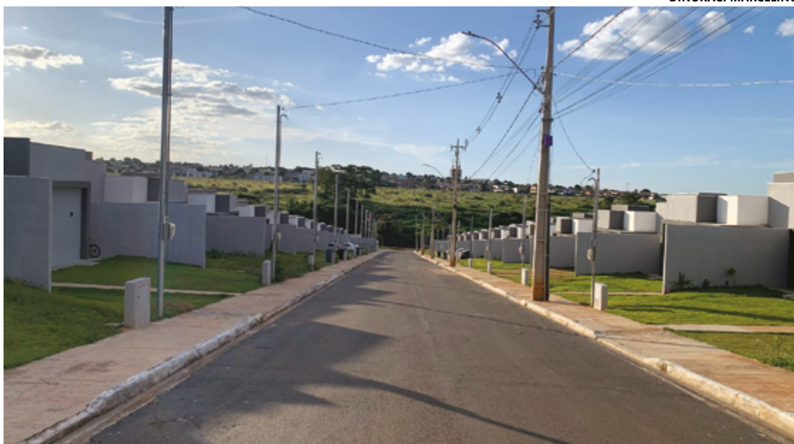
Condomínio de casas feito para a classe C em Anápolis, na região Sul.

Diversos condomínios fechados já estão consolidados na cidade. O Residencial Royal Village I, na Chácara Colorado, e o Residencial Royal Village II, no Parque dos Pirineus, são exemplos