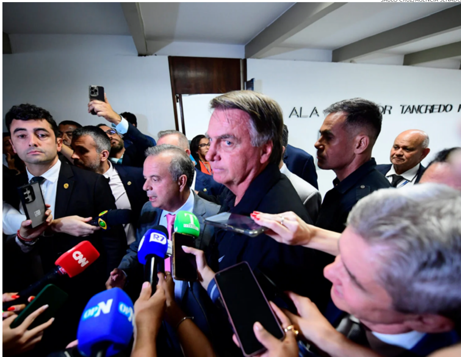
Jair Bolsonaro fala com jornalistas em visita ao Senado, na última terça-feira, 18, e diz que não há liberdade de expressão no Brasil

Ele disse que há condenados a devolver bilhões, que firmaram delações premia-