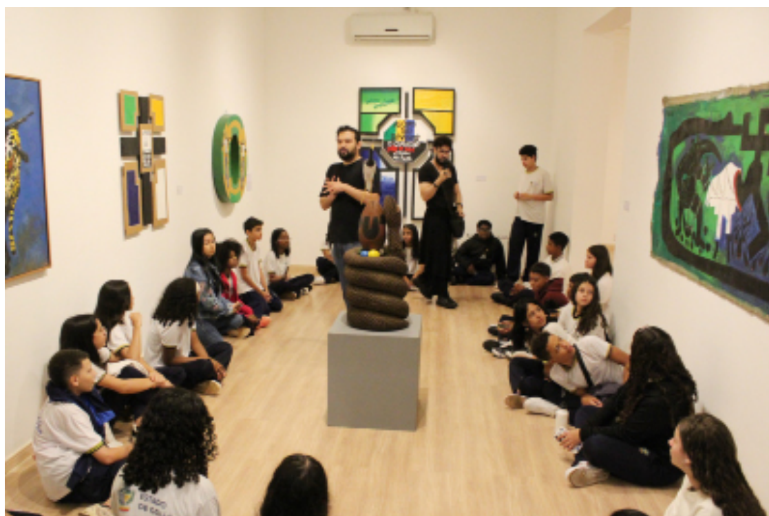
Exposição na Galeria Antônio Sibasolly segue até o fim do próximo mês, com ações educativas

“Fica evidente o impacto cultural na vida das crianças e adolescentes, considerando que parte delas está vivenciando essa experiência pela primeira vez”, afirma