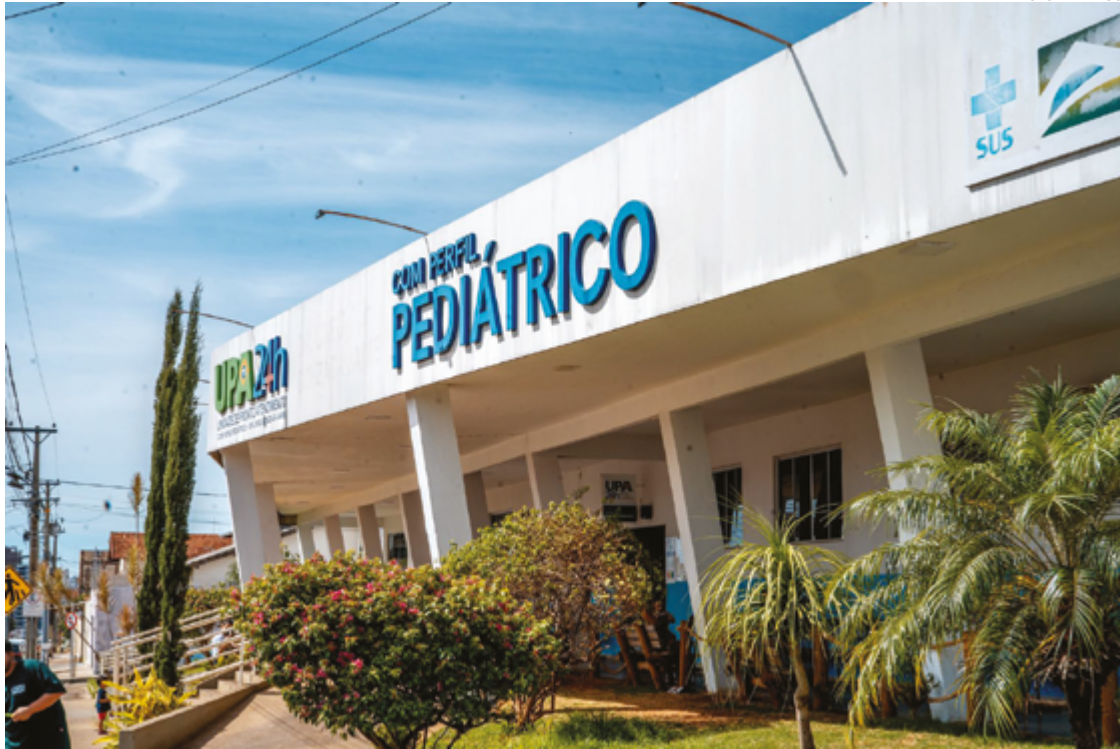
Fachada da UPA Pediátrica, que tem recebido muitos pacientes com viroses neste período

A estratégia foi montada para momentos de grande fluxo de atendimento, geralmente no período noturno. Nestas ocasiões, os pacientes serão encaminhados para a Unidade Básica de Saúde (UBS) e o Centro de Especialidades Odontológicas (CEO) do bairro Maracanã, ambos ao lado da UPA