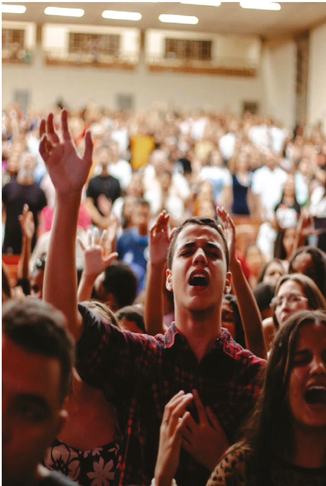
Comepe em 2024 reuniu diversos fiéis durante o carnaval e é nova opção este ano

ceiro, o congresso também tem um papel essencial no fortalecimento da fé dos participantes. "Espiritualmente, congressos evangélicos são verdadeiros catalisadores de avivamento, promovendo um ambiente de intensa busca por Deus, reflexão profunda e crescimento na fé. Há um mover poderoso do Espírito Santo que renova vidas, desperta chamados e acende um novo fervor espiritual", ressalta o pastor.