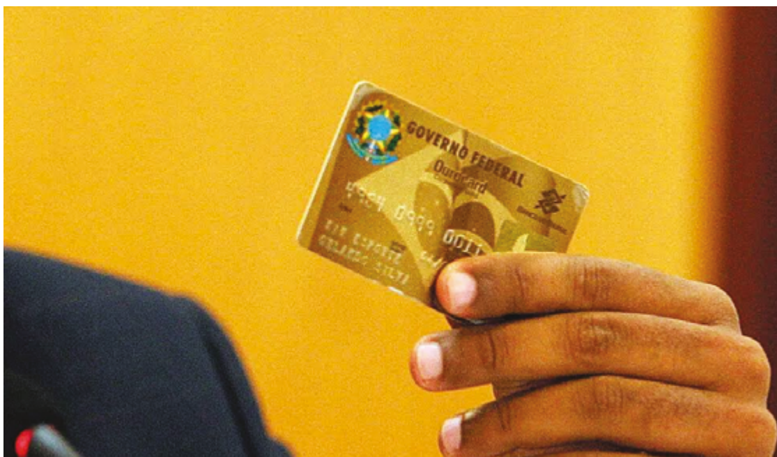
Cartão corporativo do governo federal. Prefeito propõe implantar modelo em Anápolis