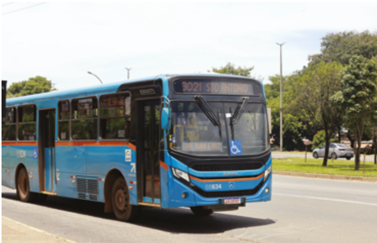
Ônibus do transporte coletivo do Entorno do Distrito Federal. Acordo evitará aumento

Proposta pelo governador Ronaldo Caiado ainda em 2023, medida vai garantir tarifas mais baratas no Entorno do DF