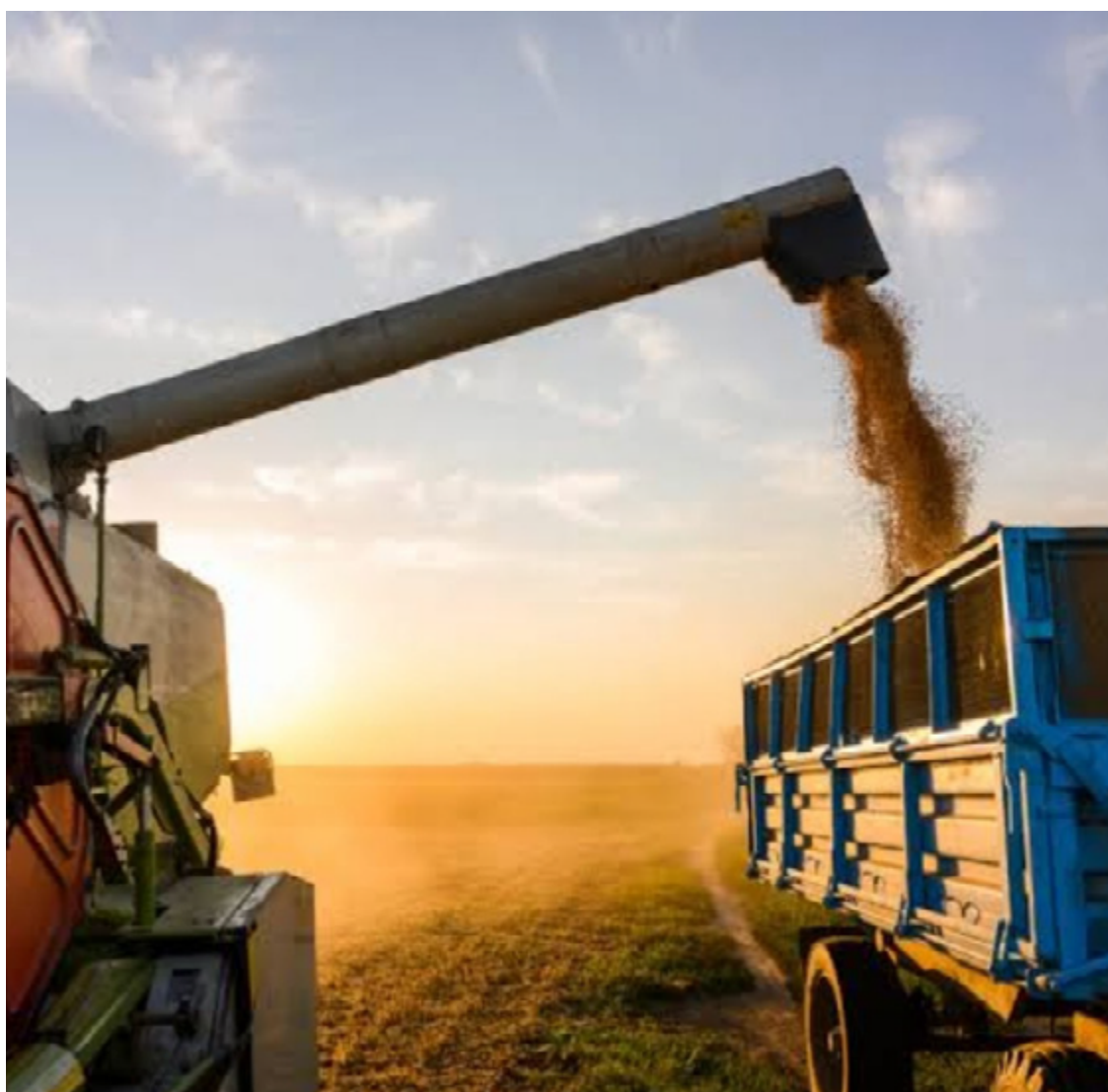
Expansão econômica apurada na pesquisa impacta na geração de empregos em Goiás

O IBCR é baseado em pesquisas como a Pesquisa Industrial Anual (PIA), a Pesquisa Anual de Serviços (PAS) e a Produção Agrícola Municipal (PAM), entre outras fontes de dados.