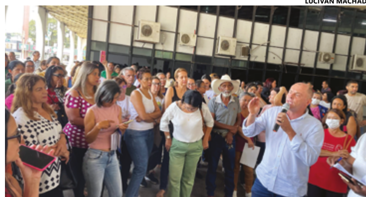
Servidores municipais da centralizada fizeram protesto e recusaram proposta do prefeito

Os servidores também pleiteiam o pagamento retroativo da data-base, uma vez que, por lei, ela é paga em janeiro e, neste ano, até pela troca de gestão, não houve negociação no primeiro mês. A proposta de Corrêa era pagar o retroativo de janeiro em março.