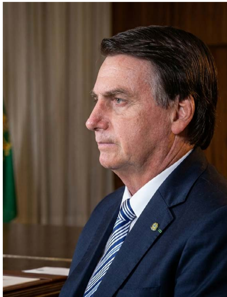
Jair Bolsonaro prefere ver Michelle candidata a vice-presidente

Ex-presidente teme que sua esposa se torne alvo de ataques agressivos e do "jogo sujo" da política