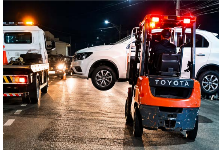
Após constatarem descumprimento de sinalização, agentes retiraram o veículo