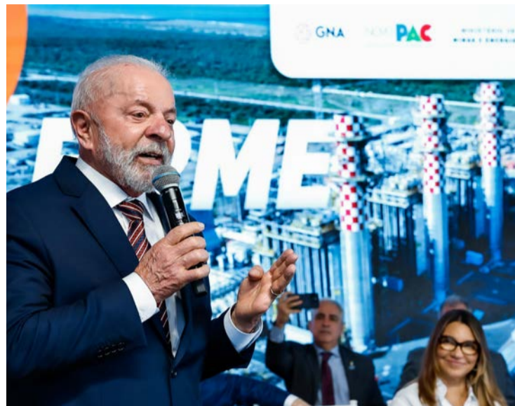
Presidente sofre sua maior rejeição no Estado de Goiás

61% desaprovam a gestão petista e apenas 37% apoiam. 66% disseram que não votam em Lula