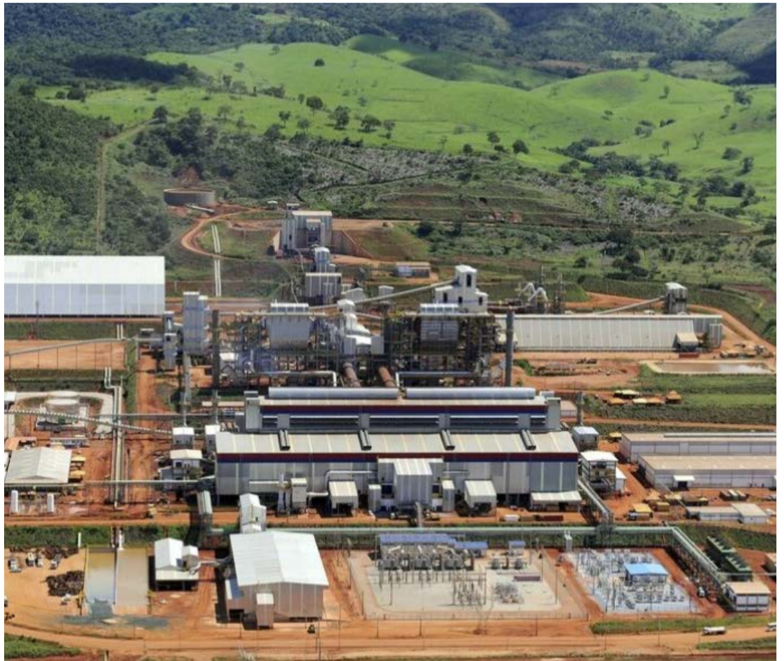
Minas de níquel da Anglo American em Goiás estão no centro de disputa bilionária entre chineses, europeus e investidores turcos

A demora também pressiona a estratégia de reestruturação da Anglo American, que pretende vender ativos de carvão, níquel, platina e diamantes para concentrar investimentos em cobre, minério de ferro e fertilizantes. Paralelamente, a empresa britânica conduz uma fusão com a Teck Resources. Segundo