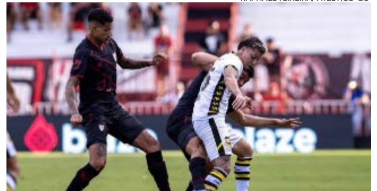
Dragão perde em casa, e desperdiça chance de subir na tabela da Série B