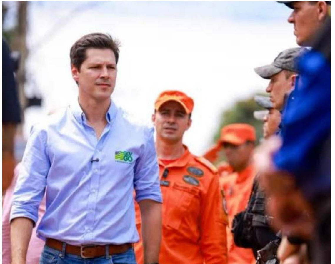
Daniel Vilela começa a expandir ações de Segurança para combater crime organizado: coleta de DNA, atenção às manobras suspeitas e uso de Inteligência Artificial inauguram novo capítulo

Ao comentar a ofensiva policial, Daniel afirmou que o Estado seguirá endurecendo o combate às facções criminosas e aos crimes financeiros. Somente na terça-feira (19/5), a Polícia Civil deflagrou seis operações simultâneas, com cumprimento de mandados em Goiás, São Paulo, Santa Catarina, Mato Grosso e Distrito Federal. Entre as ações, esteve a sétima fase da Operação Destroyer, que resultou em 276 prisões e bloqueio de R$ 235 milhões em bens ligados ao crime organizado.