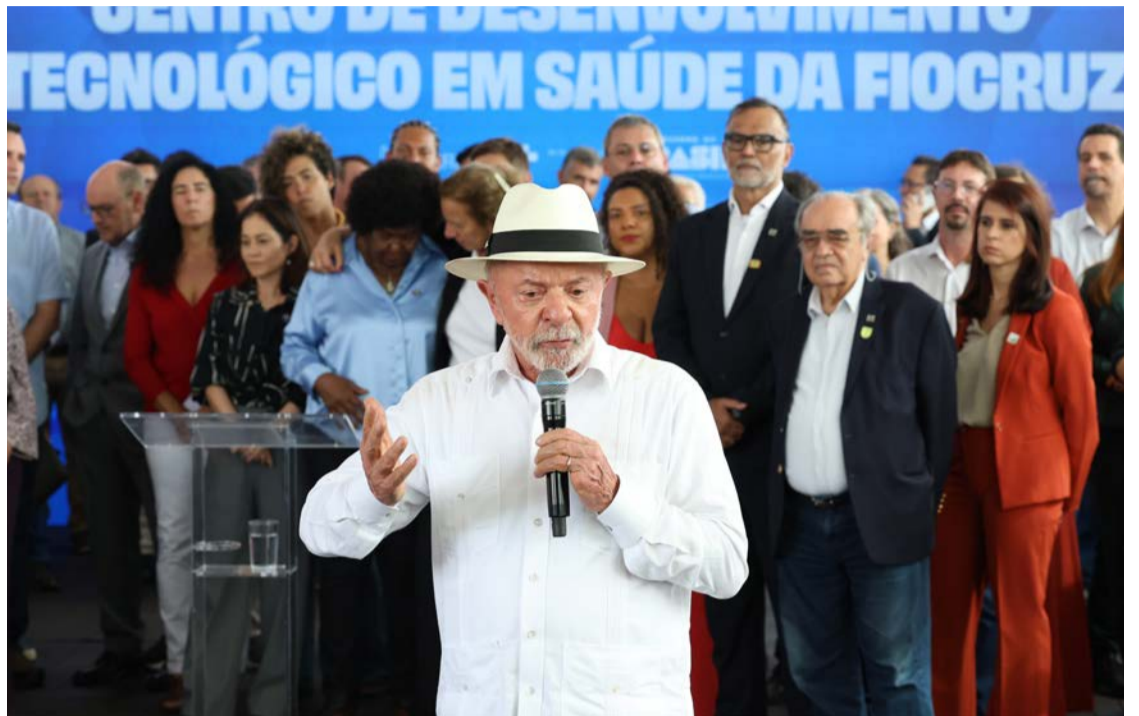
Presidente Lula vê a imagem do governo se recuperar de forma lenta e gradual

Esta foi a primeira rodada da pesquisa realizada após a divulgação, pelo Intercept Brasil, de mensagens atribuídas ao senador Flávio Bolsonaro. No conteúdo revelado, o parlamentar solicita apoio