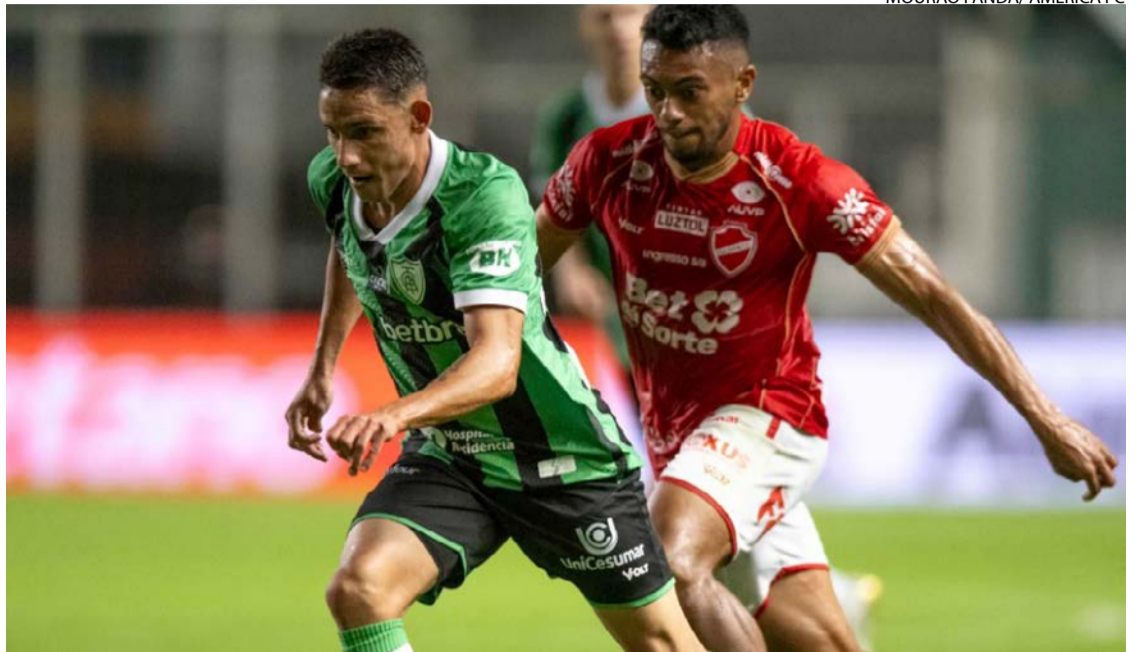
Equipe goiana incendiou partida e lutou para buscar virada na capital mineira