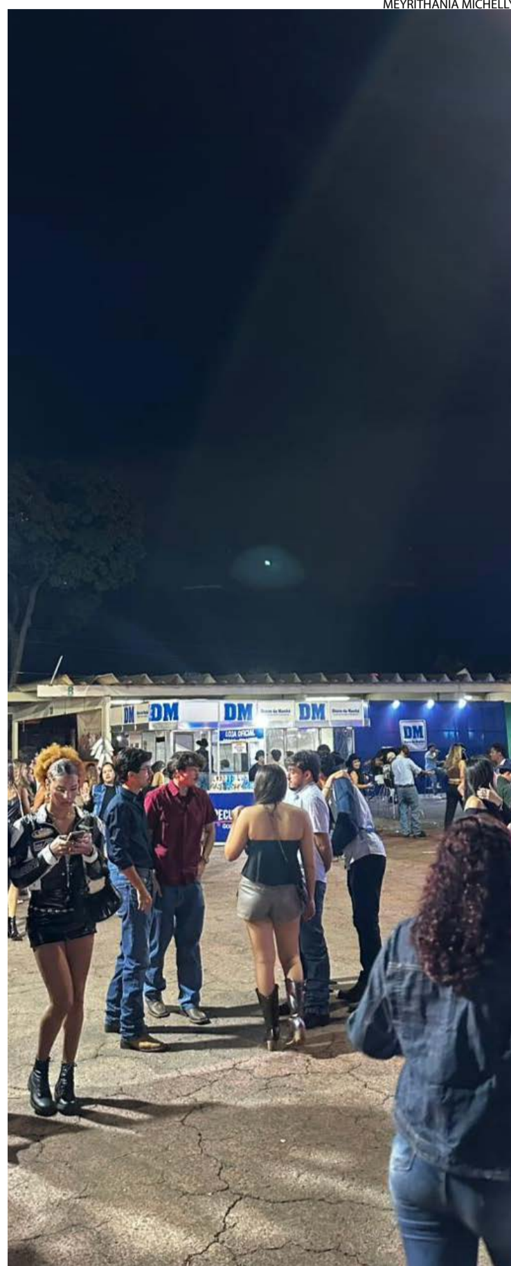
Espaço ficou localizado no corredor da entrada principal

Entre uma risada e outra, o cantor relembrou a inspiração para o nome artístico e contou que a referência surgiu do famoso personagem Jiraiya, conhecido por diferentes gerações. A conversa seguiu no estilo característico do artista: espontânea, irreverente e repleta de histórias curiosas que ajudam a explicar o fenômeno que conquistou milhões de seguidores nas redes sociais.