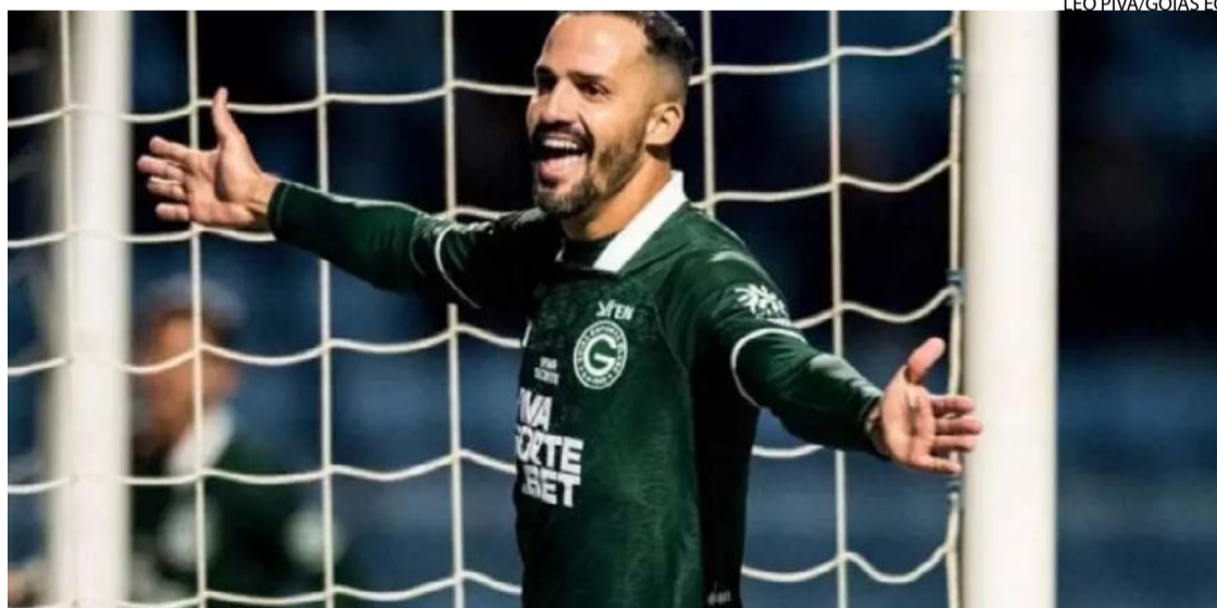
Goiás supera o Avaí na Ressacada, em Florianópolis (SC), e mantém a boa fase na Série B