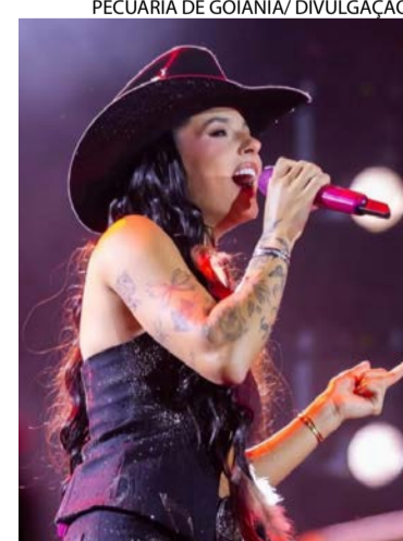
Artista levou multidão ao delírio em espetáculo aguardado

A Pecuária chegou ao último dia neste domingo (24/05) com uma programação que reúne astros do pagode. O encerramento do evento contou com apresentações de Raça Negra e Categoria de Base (CDB).