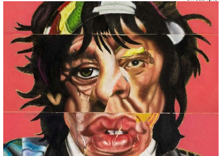
Capa de 'Foreign Tongues': últimos registros de Charlie Watts