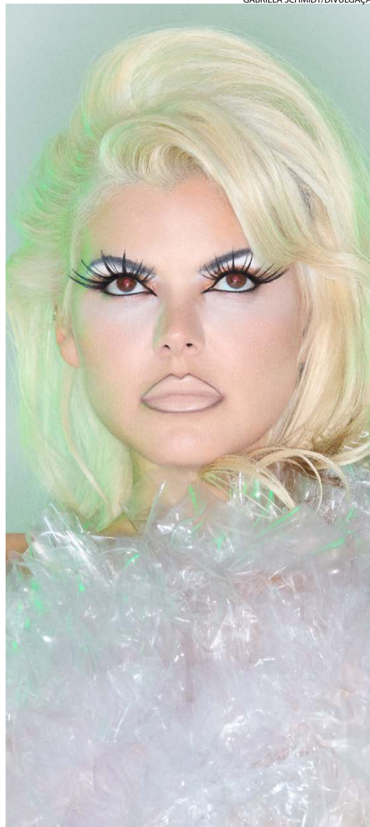
Cantora deixa de lado sofrência em turnê que chega à capital