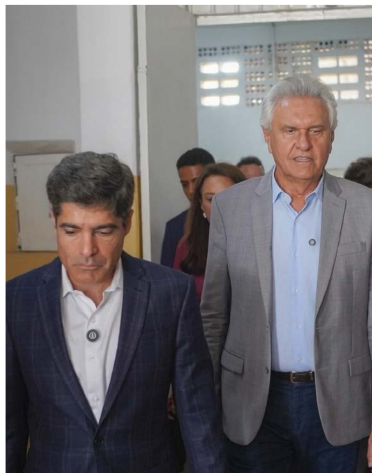
ACM Neto e Caiado durante visita ao sistema prisional em Goiás

Mesmo diante desse quadro, ACM Neto indicou que pretende manter uma postura de equilíbrio, evitando fechar portas com aliados que apoiam outros nomes. Ele ressaltou que sua prioridade será preservar alianças regionais e respeitar a diversidade de posições dentro de sua base, ao mesmo tempo em que reafirma a proximidade política com Caiado como um dos pilares de sua estratégia para 2026.