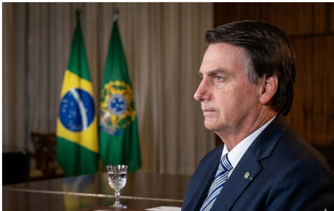
Jair Bolsonaro, ex-presidente da República, terá sua pena reduzida

"Vamos expor o acordo. Os vitoriosos da semana passada são a organização criminosa que tentou o golpe à democracia, com a derrubada do veto, e a do banco Master. Essa foi a 'vitória' do acordo, que de um lado derrubou a dosimetria e do outro protegeu o ministro Alexandre de Moraes, os congressistas envolvidos com o Master, derrubando