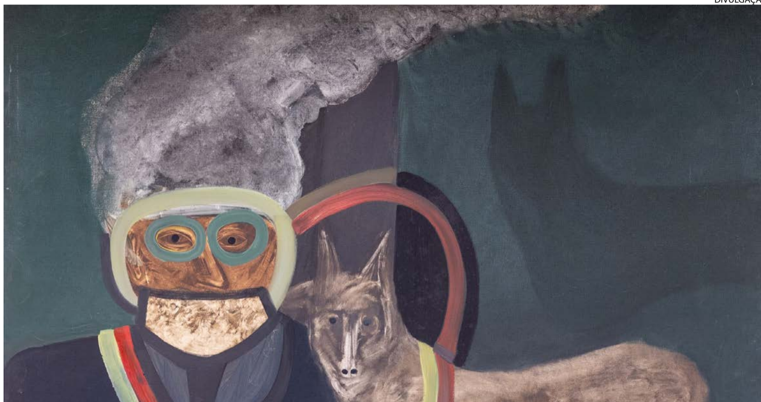
Óleo sobre a tela: obra 'Cachorro Premiado' foi pintada por Siron durante os anos 1970

Com curadoria voltada à arte como leitura do mundo, mostra articula temas como fome, desigualdade e repressão. Artista plástico se destaca por obra atenta ao cenário político e social de sua gente