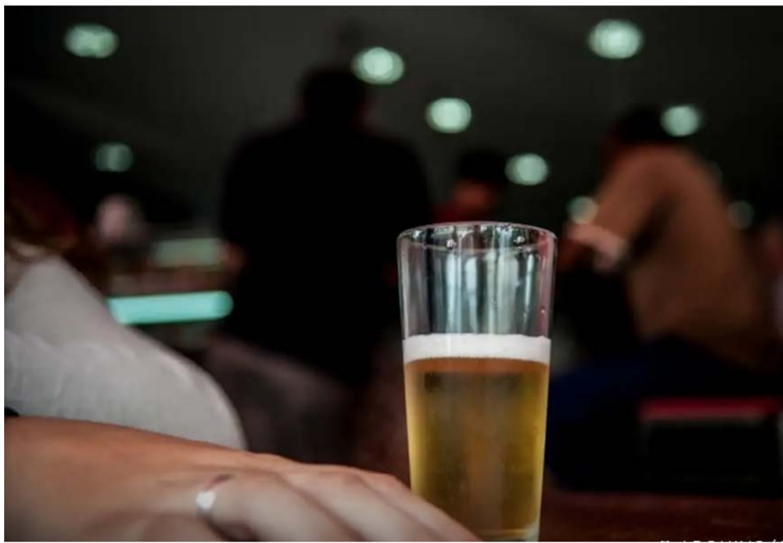
Resultado foi impulsionado pelo Carnaval e superou estimativas do mercado, com expectativa de aceleração nos próximos trimestres

O desempenho ocorre após a empresa apontar, no fim de 2025, preocu-