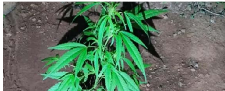
Polícia apreendeu o pé de maconha cultivado no quintal