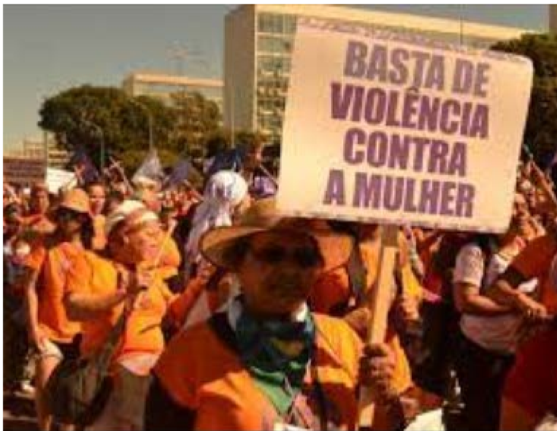
Em todo o mundo, cerca de 608 milhões de mulheres com 15 anos ou mais já sofreram violência de parceiro íntimo

Na prática, isso coloca a violência entre os principais fatores de risco à saúde de mulheres de 15 a 49