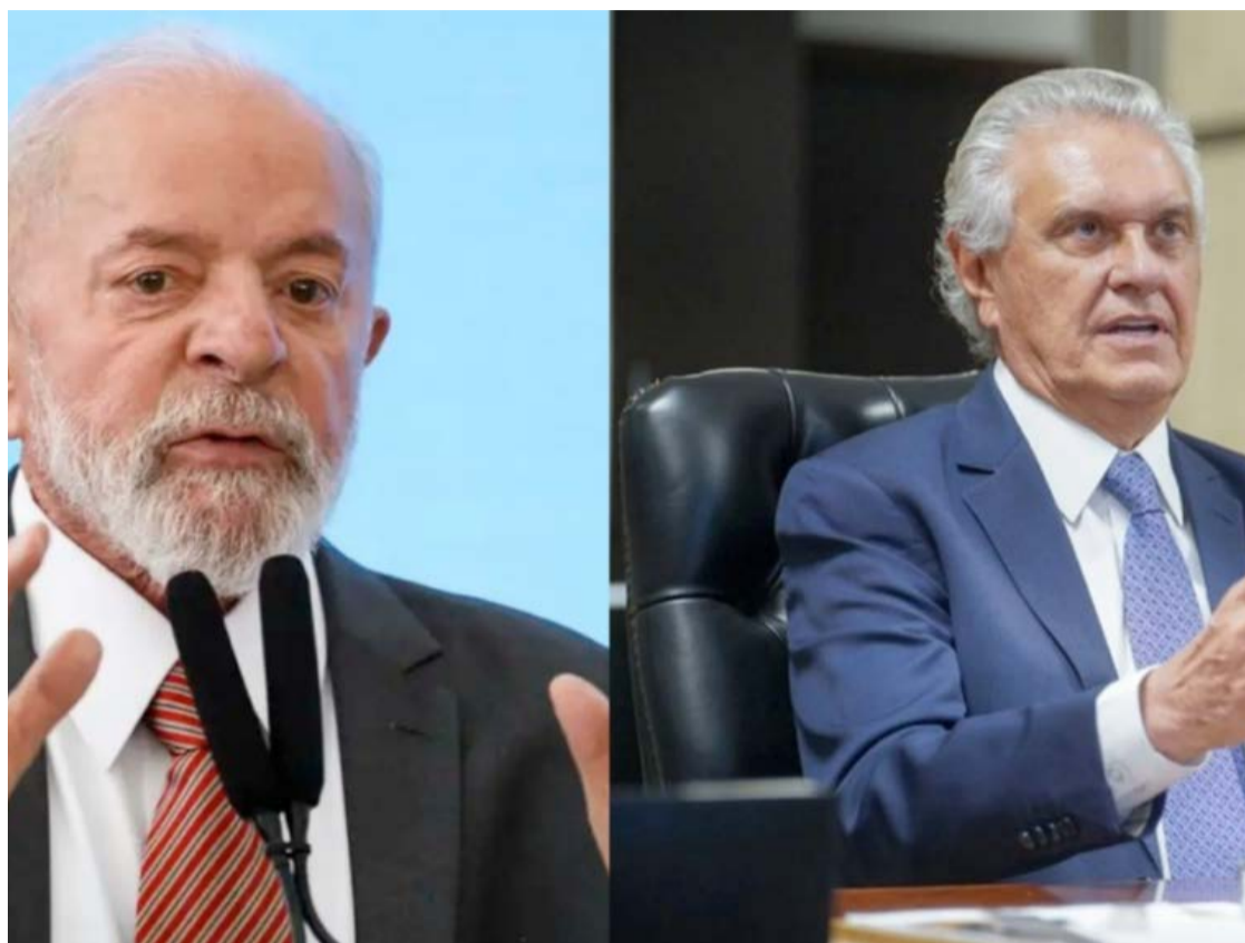
Presidente Lula e Caiado: empate técnico dentro da margem de erro