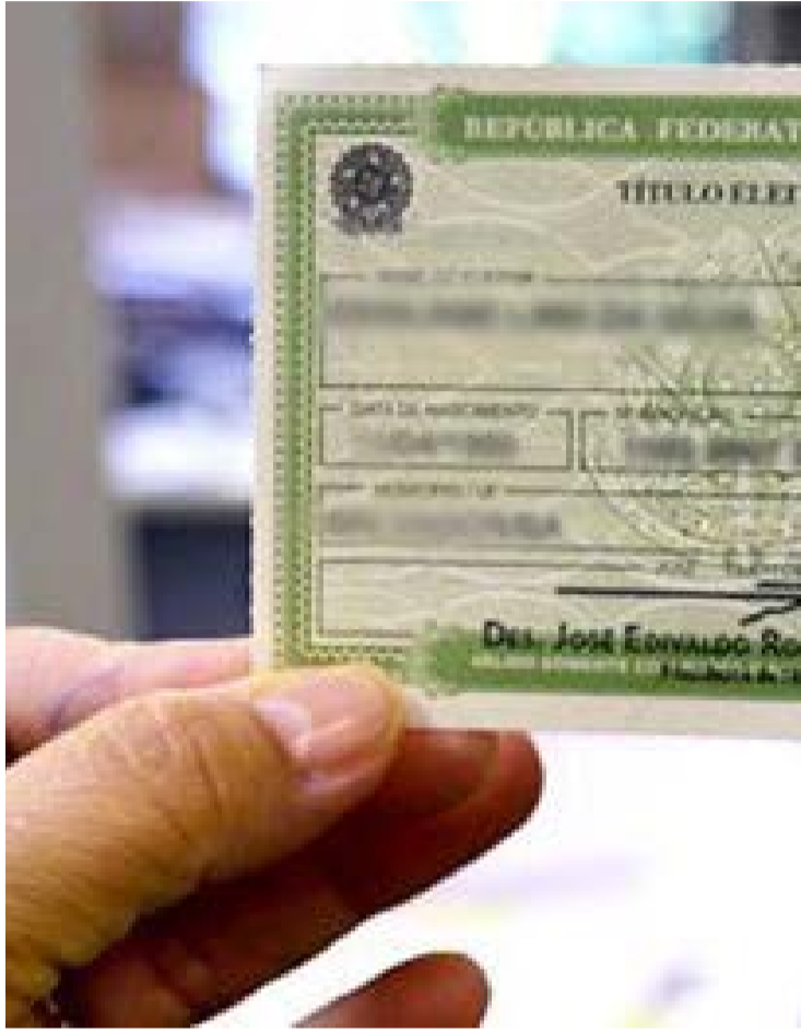
Quem não regularizar a situação dentro do prazo não poderá votar

Quem não regularizar a situação dentro do prazo não poderá votar nem se candidatar neste pleito, já que o cadastro eleitoral só será reaberto após o segundo turno.