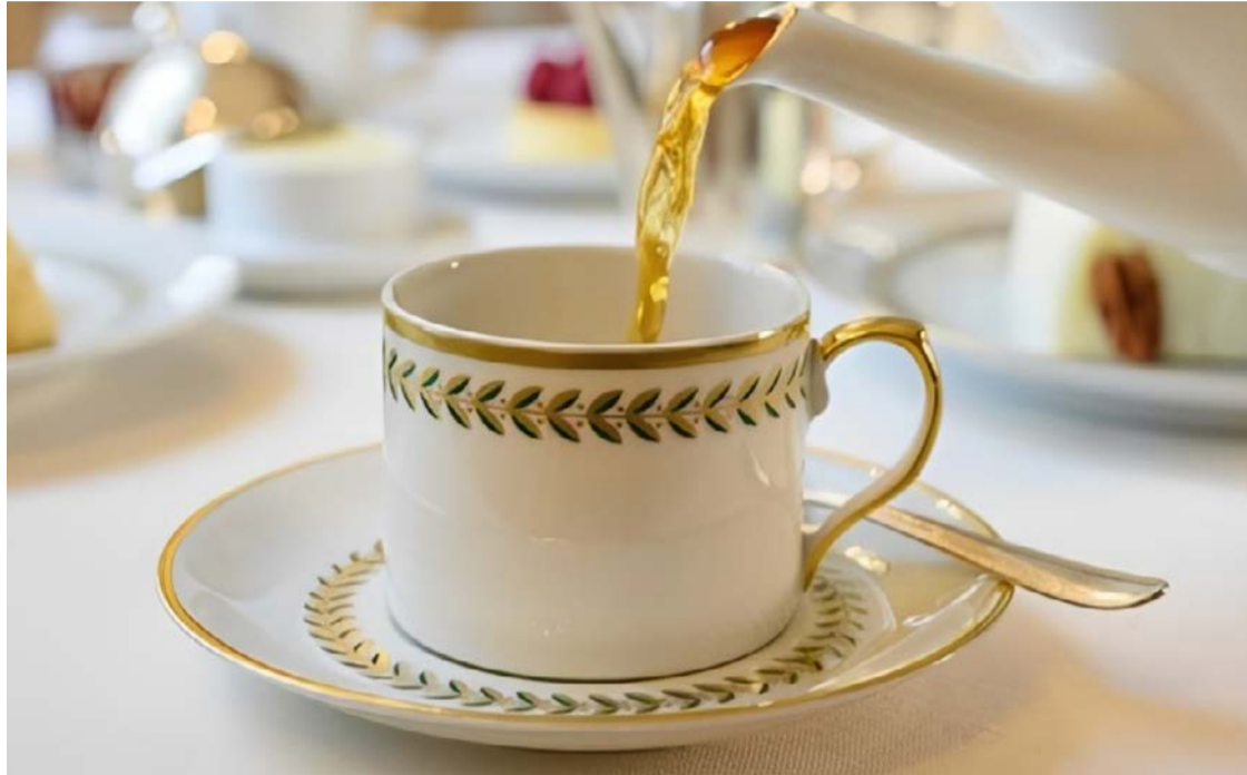
Bastões da civilidade: chá sobrevive ao ritmo frenético do mundo contemporâneo

Símbolo de história, o chá é convite silencioso para pausa, um exercício de presença e, acima de tudo, ferramenta sofisticada de diplomacia social