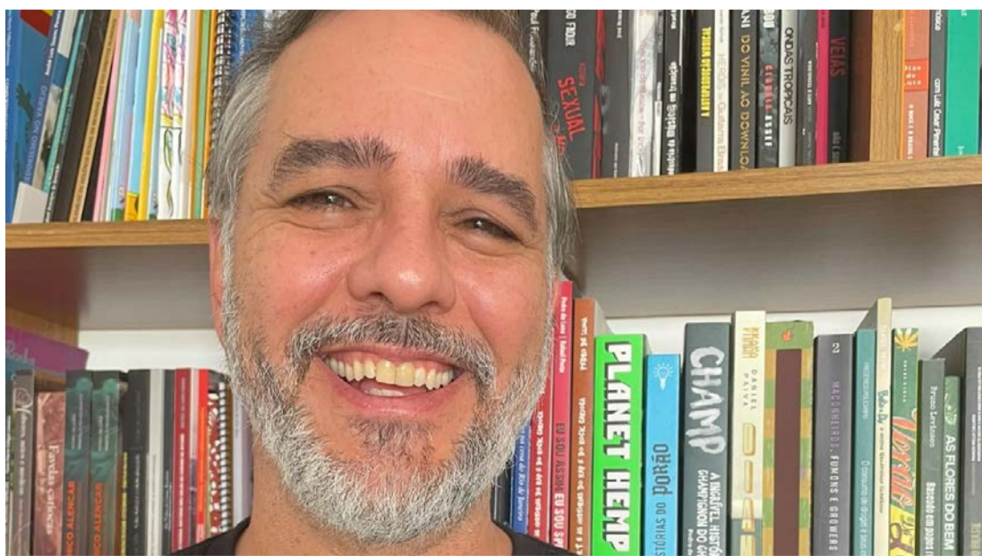
Pedro de Luna perfilou banda pernambucana Mundo Livre S/A em livro publicado em 2024

A programação de quarta também inclui o quadrinista Márcio Paixão