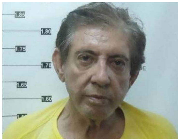
Líder religioso permanece em prisão domiciliar em Anápolis

Somatório das penas por crimes sexuais chegava a quase 480 anos em primeira instância