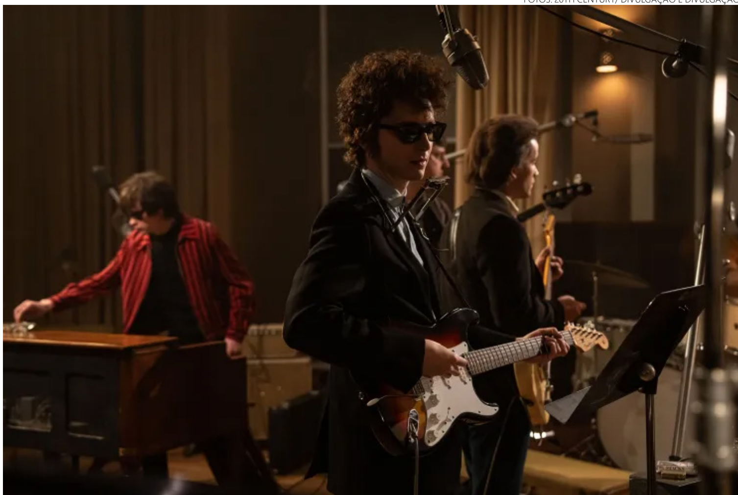
Trovador: Timothée Chalamet interpreta o cantor folk Bob Dylan em aguardada cinebiografia que entrará em cartaz no mês que vem

O Brutalista. No pós-guerra, em 1947, um arquiteto