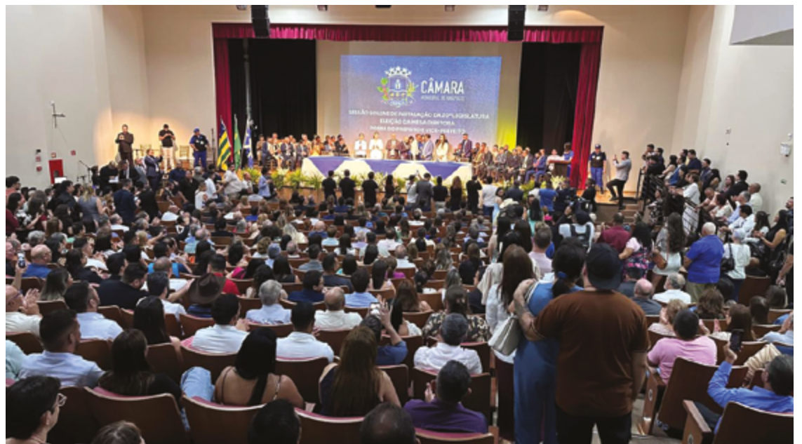
Cerimônia teve as presenças de autoridades municipais, estaduais e federais, convidados e população em geral