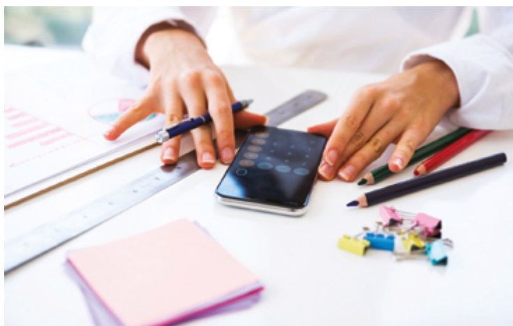
Hábito de comprar pelo celular levam pessoas a comprar por impulso

duzir as compras impulsivas, de acordo com Cespe, é limitar o acesso a aplicativos de e-commerce. "Eu sugiro organizar esses apps em pastas menos visíveis no celular, o que reduz a tentação de entrar frequentemente", recomenda.