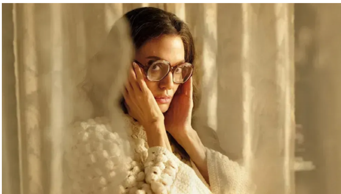
Maria Callas: Angelina Jolie vive últimos dias da cantora de ópera em longa elogiado pela crítica

húngaro tenta reconstruir sua vida nos Estados Unidos. Com Adrien Brody, o longa indicado para o Globo de Ouro de melhor filme (drama) estreia em 6/2.