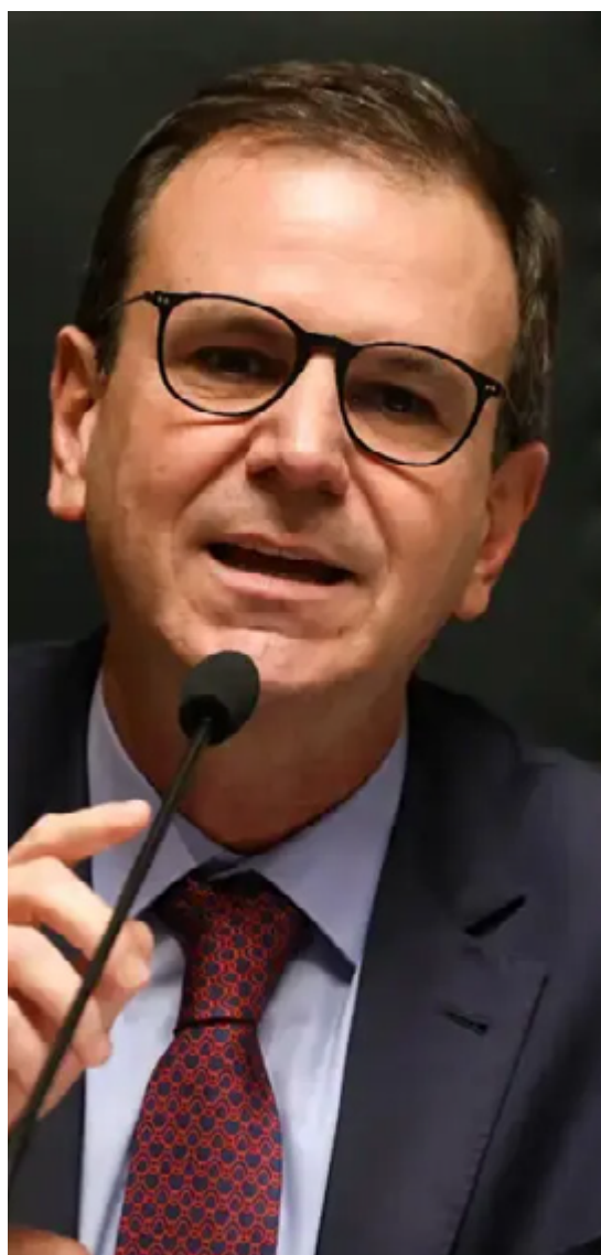
Eduardo Paes (Rio de Janeiro)

Já a função julgadora diz respeito à apreciação das contas públicas e à apuração de