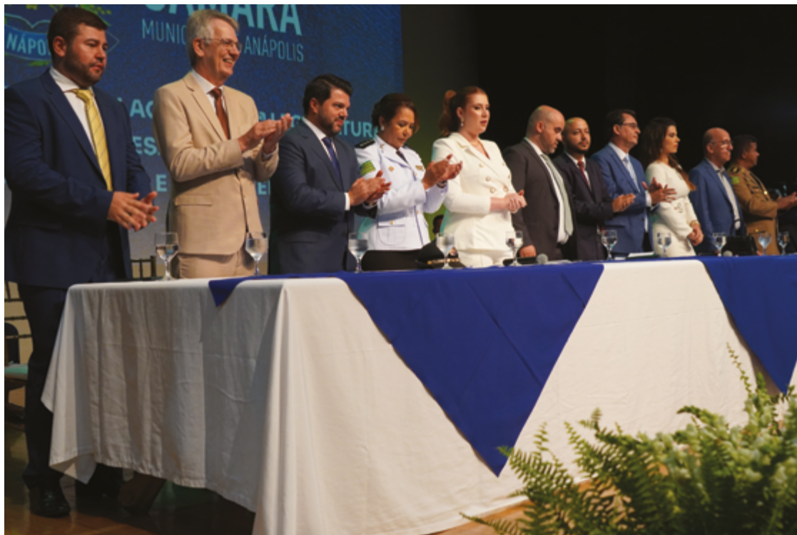
Prefeito afirma que todos os vereadores terão acesso ao Executivo para executar ações que beneficiem a população