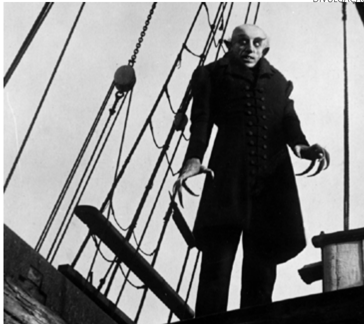
'Nosferatu': clássico do expressionismo alemão dirigido por F.W., em 1922