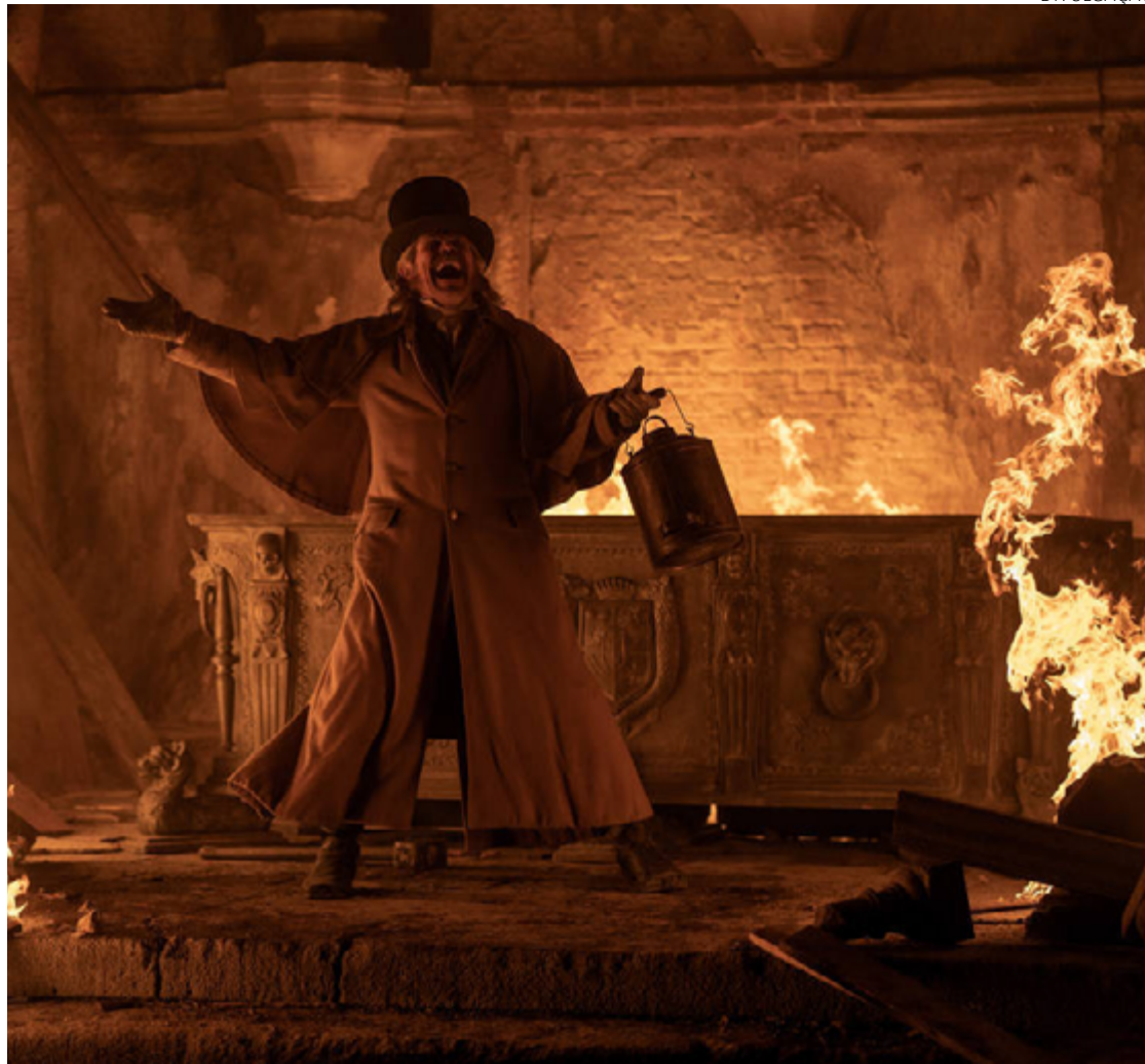
Diretor descreve longa como história demoníaca que envolve um triângulo amoroso

Em "O Farol", de 2019, ele enquadrava uma briga de egos masculina em torno da fállica construção náutica que dá nome ao filme. Em "O Homem do Norte", de 2022, também centrou a trama em dois machões, que no ápice ficam com-