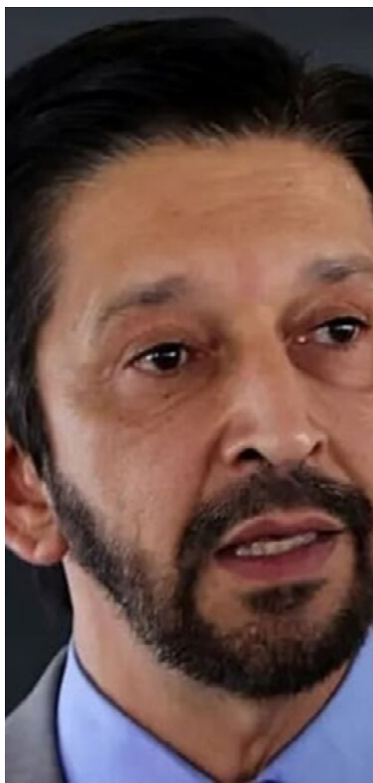
Ricardo Nunes (São Paulo)

eventuais infrações político-administrativas por parte do prefeito e dos próprios membros da Câmara Municipal.