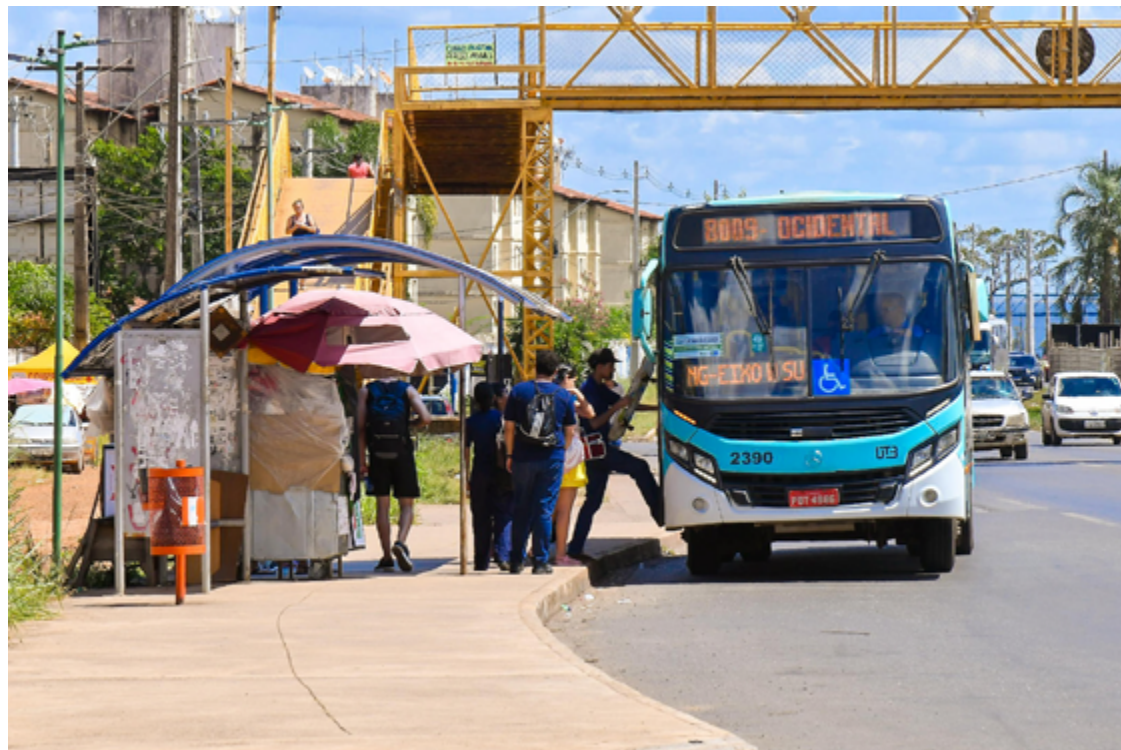
Governo consegue suspensão da tarifa e negocia com DF consórcio para transporte no Entorno

O pedido de adiamento do reajuste, que seria aplicado independentemente da decisão sobre o subsídio, foi encaminhado ao ministro dos Transportes, Renan