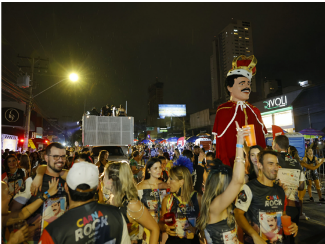
Olhos e sorrisos: foliões permaneceram na avenida até a noite