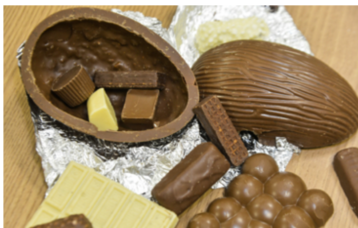
Anápolis terá tradicional oficina para ensinar pessoas a produzi-los

Os interessados podem entrar em contato através do número (62) 3902-2034 para obter mais informações, ou através do WhatsApp (62) 9 8469-9686.