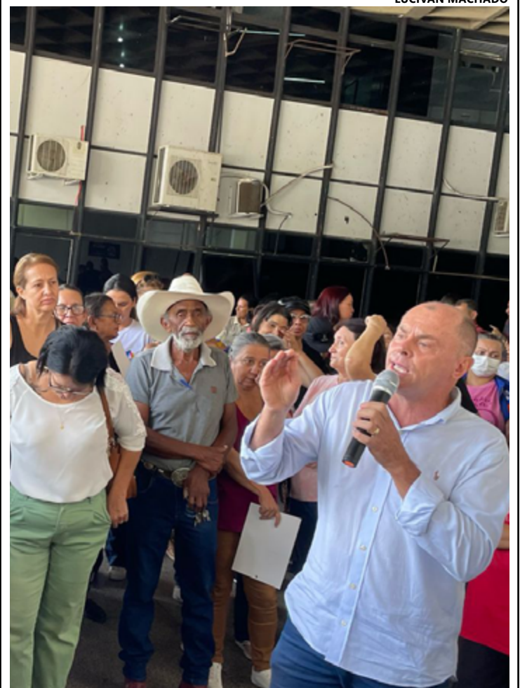
Servidores municipais da centralizada fizeram protesto e recusaram proposta do prefeito