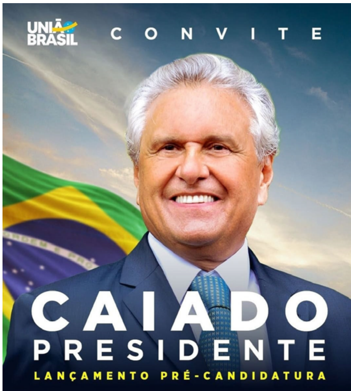
Ronaldo Caiado lançará sua pré-candidatura em um mês: evento ocorrerá em 4 de abril, uma sexta-feira, em Salvador (BA), no Centro de Convenções

Ao longo dos anos, Ronaldo Caiado foi articulador e mentor da direita brasileira, destacando-se na oposição aos governos de Lula e Dilma. Firmou sua