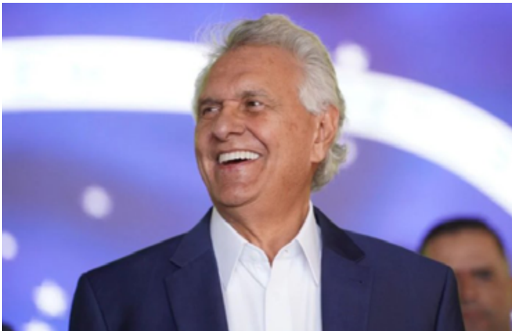
Governador Ronaldo Caiado confirmou data de lançamento de sua pré-candidatura no Nordeste

Governador escolheu Salvador para evento que marcará entrada na disputa de 2026. Data faz referência ao número do partido