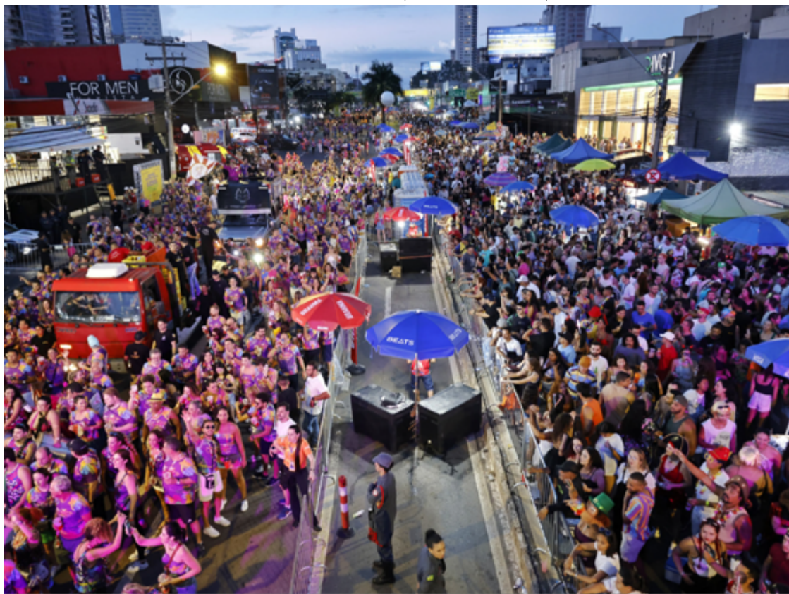
Vocação democrática: Circuito apostou na pluralidade musical