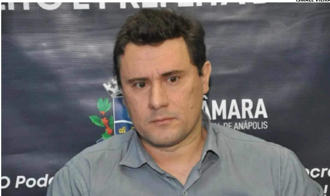
Michel Roriz, presidente estadual do Cidadania, fala de novos rumos do partido