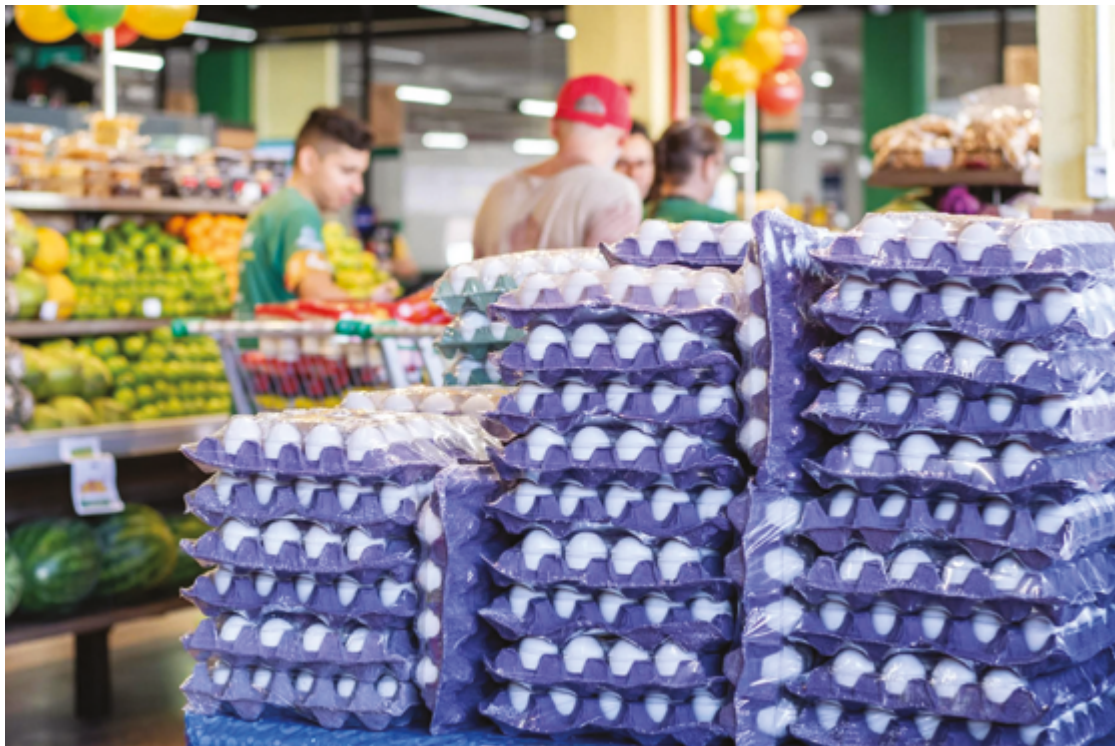
Ovos ficam cada vez mais caros para os consumidores e há vários motivos para a alta

A pesquisa do Procon de Anápolis também revelou que os preços podem variar bastante entre os estabelecimentos da cidade. Enquanto a dúzia de ovos brancos foi encontrada por valores entre R$ 10,19 e R$ 11,99, a dúzia de ovos vermelhos variou entre R$ 11,59 e R$ 12,99. Já a cartela com 30 ovos vermelhos apresentou uma diferença de 44% entre o menor e o maior preço registrado.