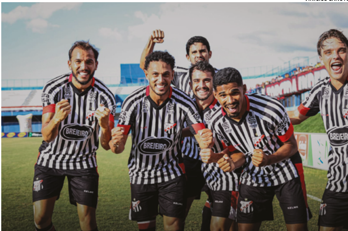
Sob forte calor, Anápolis bateu o Goianésia com o apoio da torcida no Jonas Duarte

Melhor no segundo tempo, o Tricolor da Boa Vista. Aos cinco minutos, depois de cruzamento da esquerda, o zagueiro André, bem posicionado na área, completou para as redes. Aos 12, novamente em jogada