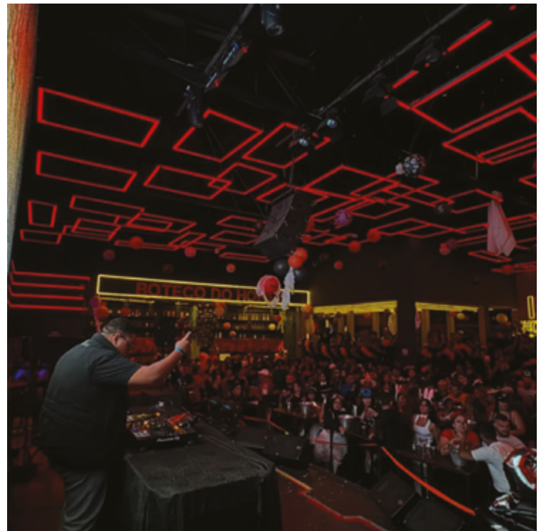
Boates e clubes noturnos existem, mas são limitados para uma cidade do porte de Anápolis

Fernanda também destaca que a falta de variedade faz com que muitos moradores busquem diversão em municípios adjacentes.