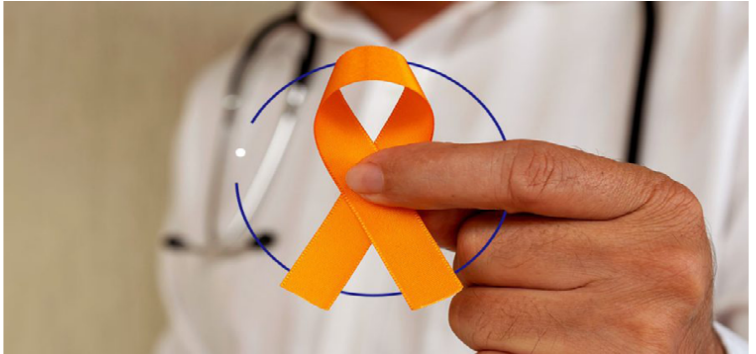
Símbolo da Campanha Fevereiro Laranja: país tem 11,5 mil novos casos por ano

Os sintomas podem variar, mas os mais comuns incluem fadiga persistente, palidez, tontura, hematomas frequentes, infecções recorrentes e sangramentos anormais. O diagnóstico