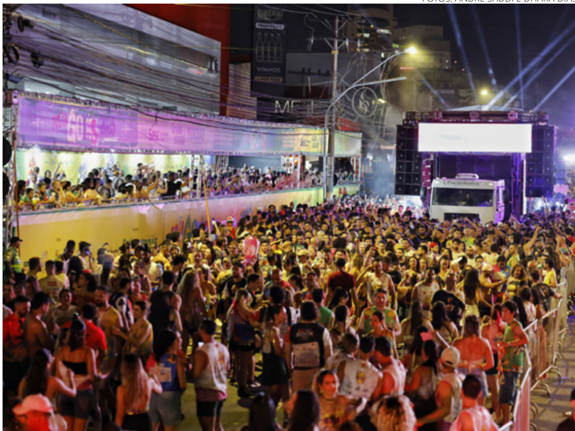
Povo nas ruas: evento reuniu pelo menos 100 mil pessoas

Localizada no coração do Beco da Rua 8, entre prédios abandonados e arte urbana, o Anexo adota uma proposta underground, como é a vibe da Liberté, mas com a pretensão de integrar a cidade à vida noturna do Centro. Goiânia andava precisando de algo desse jeito.