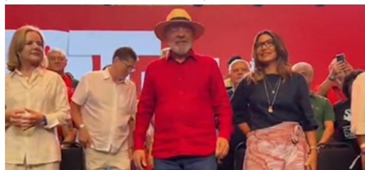
PT se reúne para celebrar 45 anos e faz 'mea culpa'. Gleisi Hoffmann fala de comida cara e Jair Bolsonaro

Petistas se reúnem para celebrar 45 anos e fazem 'mea culpa'. Gleisi Hoffmann fala de comida cara no prato e denúncia contra o ex-presidente Jair Bolsonaro