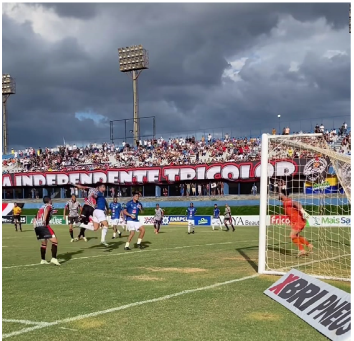
Anápolis ganhou ontem e segue favorito para partida contra Abecat, oitavo colocado

Os mandos de campo serão dos times que terminaram na frente – por exemplo, Anápolis receberá o Abecat em casa. Já o Vila terá seu jogo contra Jataiense realizado no estádio Olímpico, em Goiânia. O Goiás enfrentará o Crac em casa e o Dragão recebe o Inhumas na Capital.