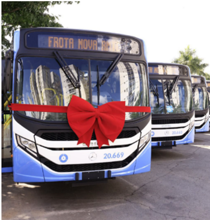
Conquista internacional coloca Goiás ao lado de algumas das mais importantes iniciativas globais de transporte público

“Demonstra que Goiás escolheu o caminho certo ao tratar a mobilidade urbana como política pública estratégica. O que estamos fazendo não é apenas renovar frota ou reformar terminais. Estamos construindo um sistema moderno, eficiente e capaz de melhorar a vida das pessoas. E que,