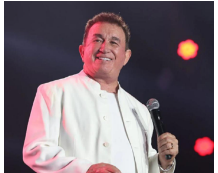
Defesa de Amado Batista recorrerá às instâncias superiores

Menino de três anos morreu afogado em uma propriedade rural do cantor em Goianápolis