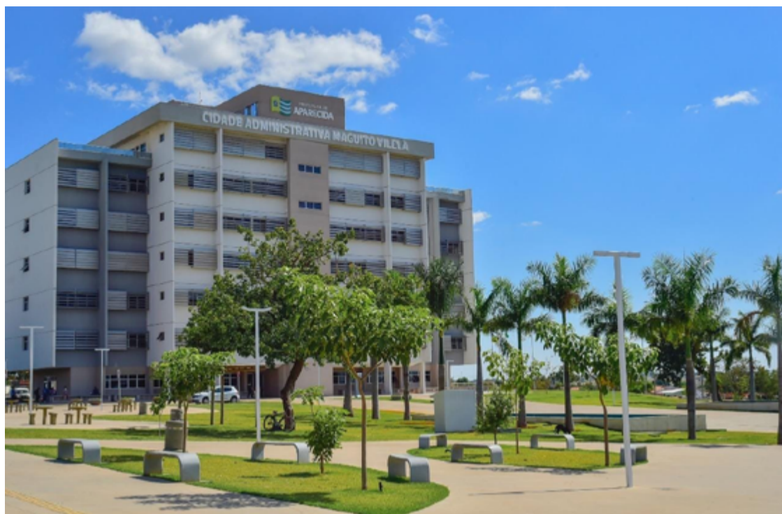
Prefeitura de Aparecida: situação fiscal equilibrada e execução de obras

tor municipal, a redução de contratações permitiu diminuir despesas com a folha de pagamento sem comprometer a prestação dos serviços públicos.