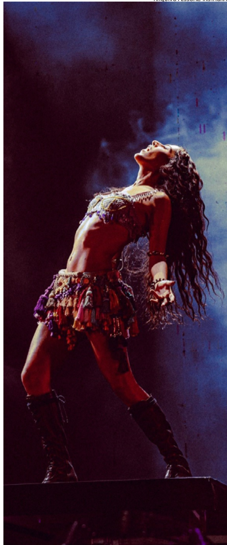
Olha ela: artista atinge maturidade artística com disco e turnê