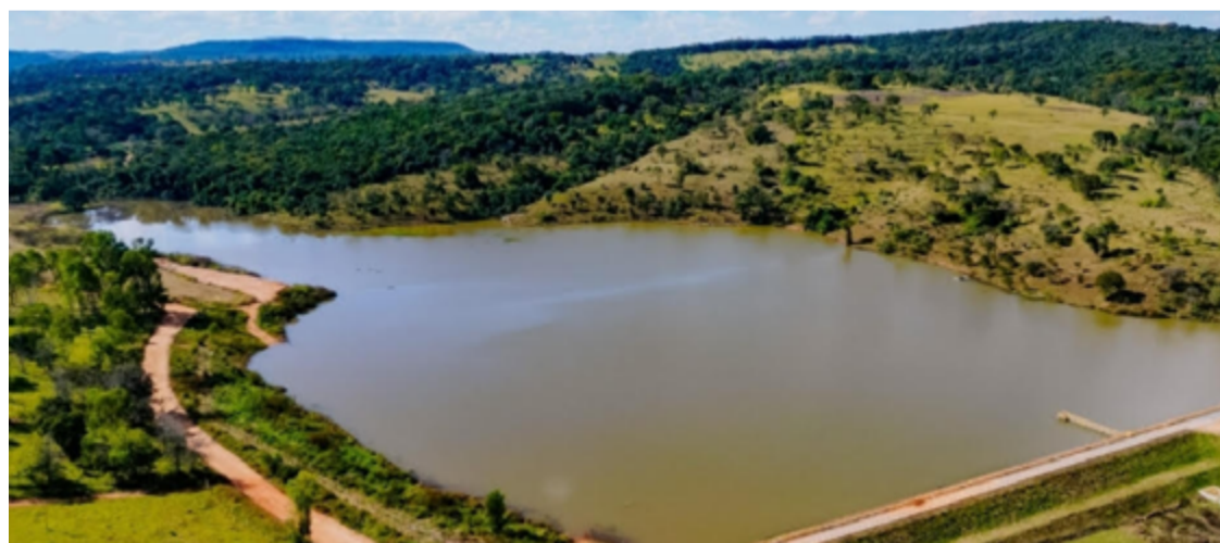
Estrutura ampliou a capacidade de reservação da Sanesc e fortaleceu a segurança hídrica da cidade