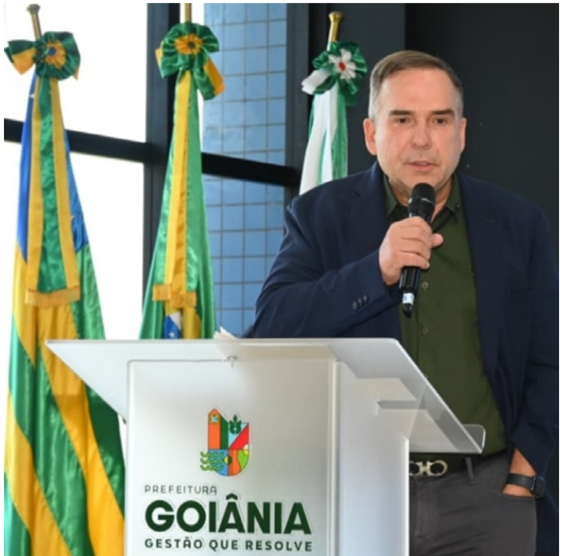
Obra anunciada por Sandro Mabel prevê reservatório capaz de armazenar até 100 milhões de litros de água

Durante o anúncio, Mabel informou que a obra será contratada em caráter emergencial para que esteja concluída até o fim deste ano, antes do próximo período chuvoso. O prefeito também destacou que novas intervenções serão executadas com base no Plano Diretor de Drenagem Urbana, elaborado pela Universidade Federal de Goiás em parceria com a Prefeitura para orientar ações de prevenção a alagamentos nas próximas décadas.