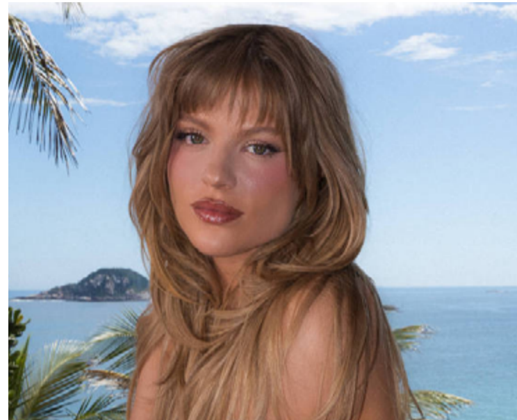
Espectáculo traz referências à música popular brasileira