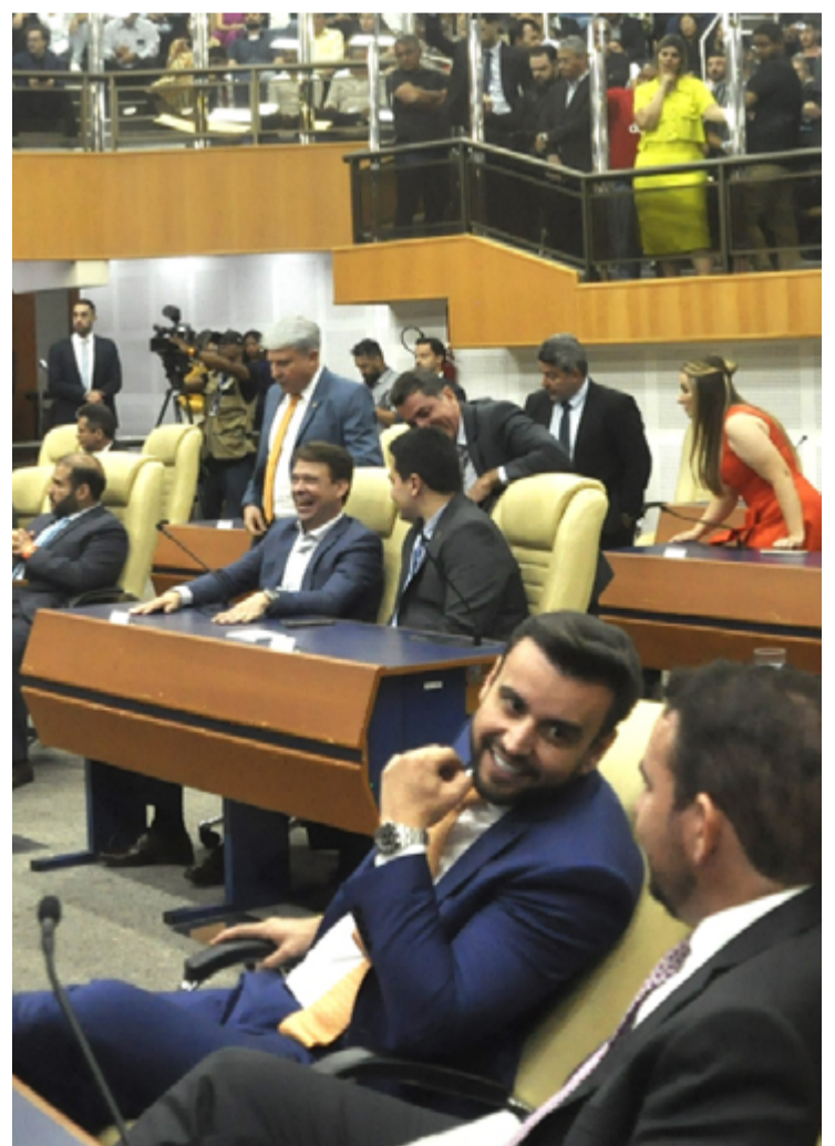
Decisão do TRE mantém vereadores do PT na Câmara de Goiânia

Com a decisão definitiva do TRE-GO, fica mantida a composição atual da bancada do Partido dos Trabalhadores na Câmara Municipal de Goiânia. O julgamento também reforça o entendimento da Corte Eleitoral goiana sobre a necessidade de comprovação efetiva de fraude para aplicação de sanções como a cassação de chapa.