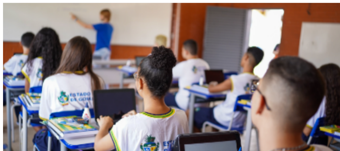
Jovens em sala de aula: escolas goianas lideram desempenho

Estudantes da rede pública goiana obtiveram a maior média do país na Redação do Enem 2025; preparação pedagógica pode explicar resultado