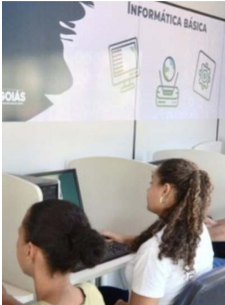
Cursos serão realizados por meio da Secti e do Goiás Social

As inscrições podem ser feitas de forma online pelo WhatsApp (62) 99849-1513 ou por formulário eletrônico.