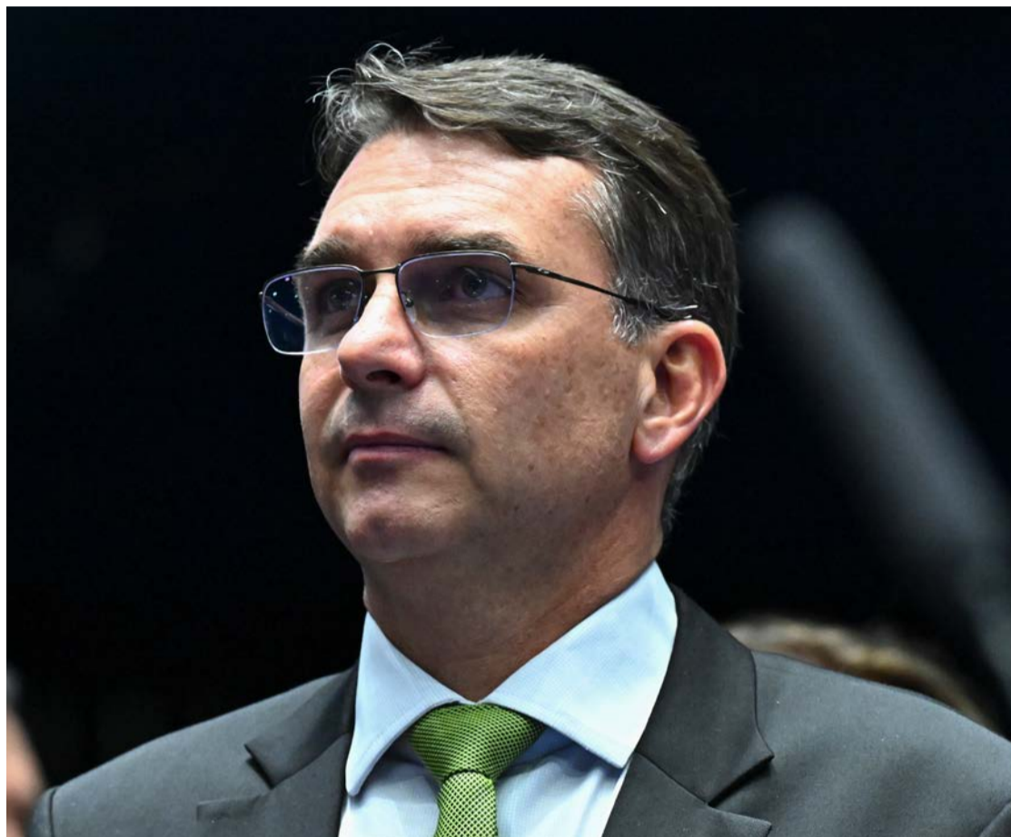
Flávio Bolsonaro tenta se livrar de Vorcaro: "não sabia que era tão grave"

Como revelou o site The Intercept Brasil, o senador pediu dinheiro ao dono do Banco Master para financiar o filme sobre seu pai. O ex-banqueiro chegou a pagar R$ 61 milhões para a produção. Desde então, Flávio vem tentando