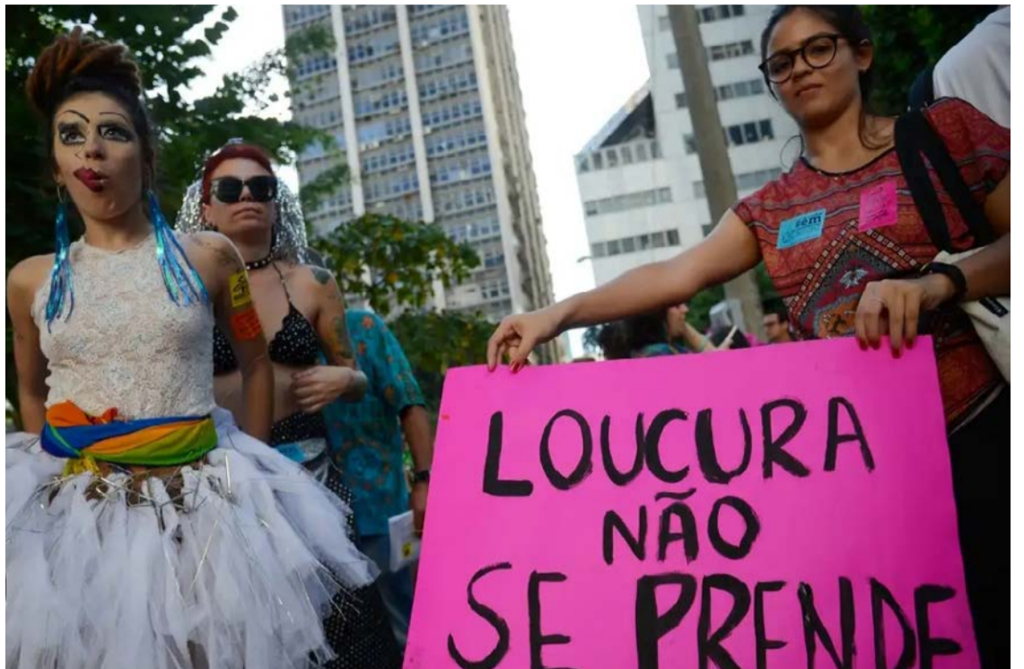
Luta Antimanicomial exige novas reflexões: protestos requerem fortalecimento dos Raps

A Abrasme também sustenta que o financiamento público dessas comunidades representa uma “privatização dos serviços” e uma distorção da política de saúde mental. A entidade defende medidas voltadas à redução de danos e reinserção social dos pacientes, modelo também apoiado por conselhos nacionais de Saúde, Direitos Humanos, Assistência Social e Política sobre Drogas.