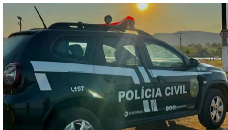
Polícia Civil foi acionada e prendeu homem que agrediu a companheira