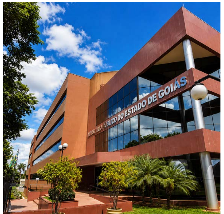
Sede do Ministério Público de Goiás: benefícios

Dados disponíveis no Portal da Transparência mostram que o MP-GO desembolsou cerca de R$ 4 milhões em passagens e diárias ao longo de 2024. Apenas nos primeiros meses de 2026, essas despesas já somam aproximadamente R$ 1,1 milhão. Atualmente, os salários-base pagos a membros da instituição variam entre R$ 34 mil e R$ 41,8 mil mensais.