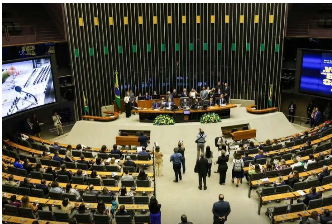
Grupo de deputados prepara pacote para atender segmento do agronegócio: Ibama e defensores do meio ambiente questionam

Outro projeto em discussão dá ao Ministério da Agricultura poder para interferir na classificação de espécies consideradas invasoras ou ameaçadas. A proposta foi motivada pela inclusão da tilápia em uma lista de espécies exóticas