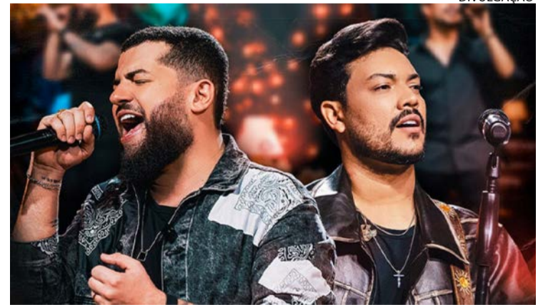
Evento vai ocorrer no próximo mês no Parque de Exposições