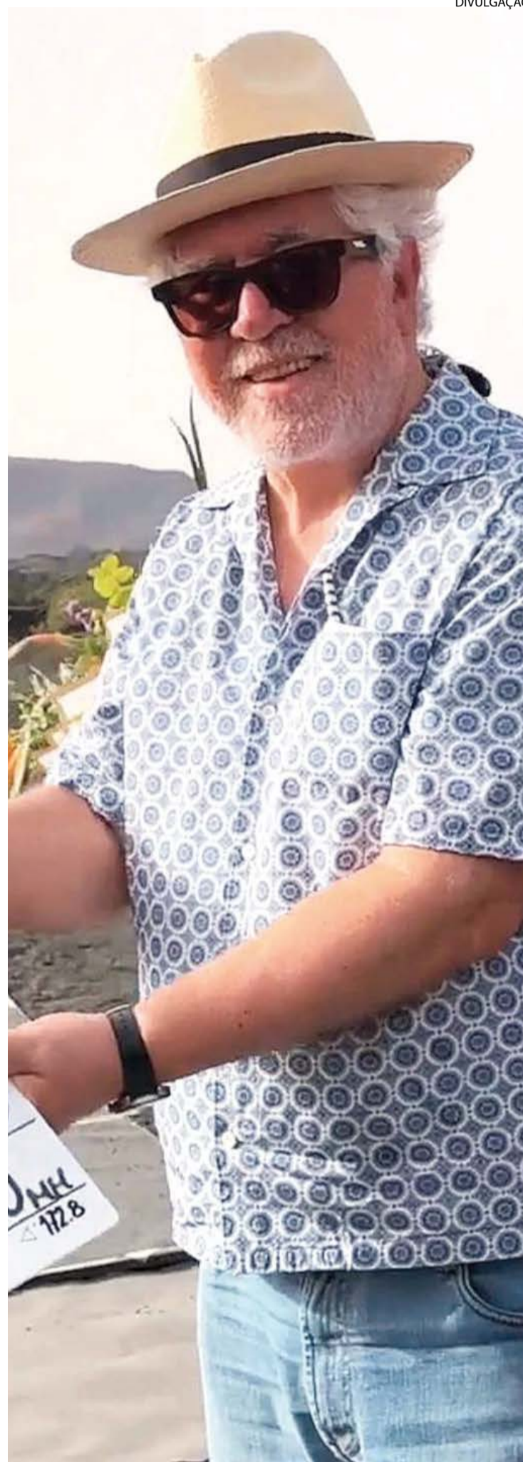
Diretor espanhol mostra como arte cura e fere em 'Natal Amargo'

Almodóvar já inseriu muito de sua vida em "Dor e Glória", de 2019, e é difícil não pensar que pode haver muito do diretor em Raúl, como se ele interrogasse a si próprio e sua criação com "Natal Amargo". É aí que o filme aponta para uma terceira história paralela — a nossa. (Folhapress)