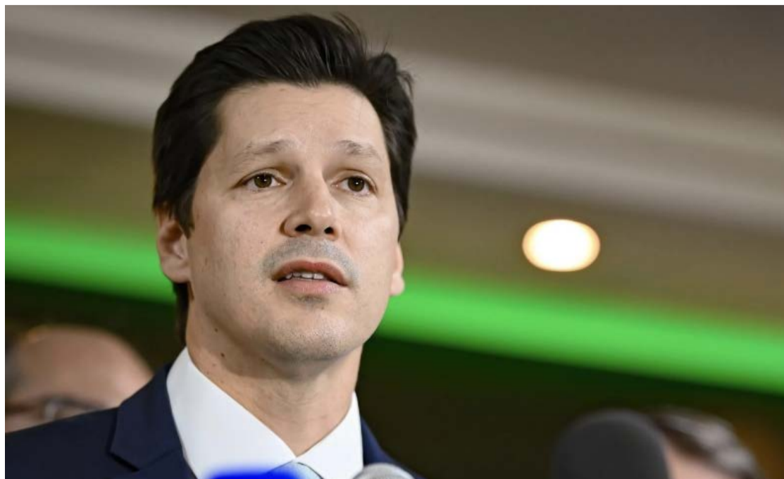
Daniel Vilela, governador: “A gente vai continuar garantindo que Goiás seja terra de gente de bem, onde bandido não se cria e não se criará”. Gestor inaugurou ontem presídio no Entorno do Distrito Federal

A 7ª fase da Operação Destroyer [ ver reportagem na página 2 ] cumpre mandados de prisão e de busca e apreensão em Goiânia, Trindade e São Luís de Montes Belos. A investigação apura a atu-