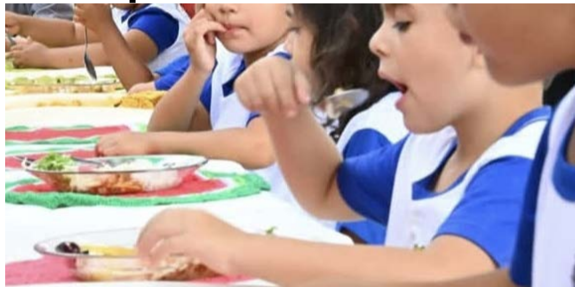
Aulas voltam ao normal nesta quarta-feira (20/5) após audiência de conciliação no TJ-GO