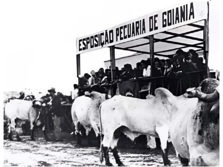
Inauguração do Parque de Nova Vila transformou a exposição