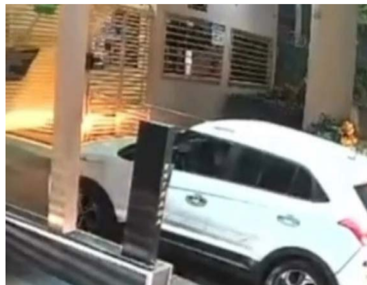
Veículo em que o suspeito dirigia: PC investiga o caso

Circunstâncias da morte ainda serão apuradas; PC investiga para esclarecer dinâmica do caso