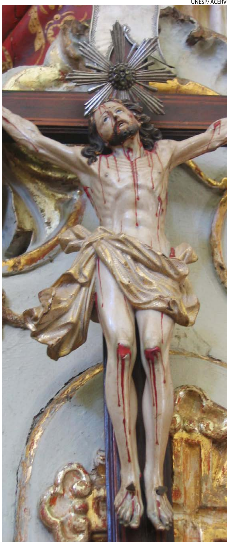
Escultura religiosa de Veiga Valle representa interpretação de Cristo