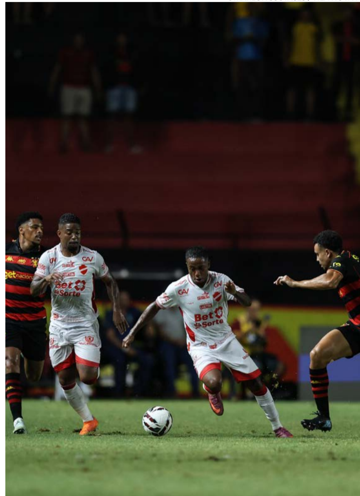
Vila Nova sai na frente em Recife, mas cede o empate no fim do jogo