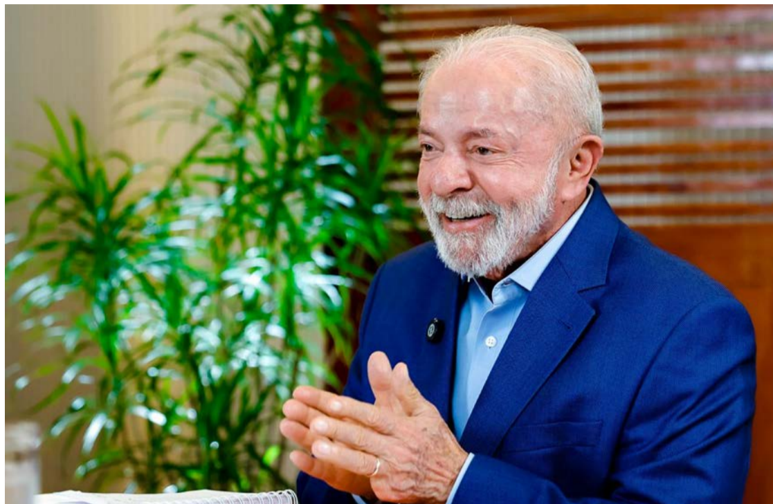
Presidente Lula dispara petardos contra senadores que criam problemas

Há possibilidade de que o chefe da pasta se dedique a apoiar a campanha de Lula ou se lance candidato ao Governo do