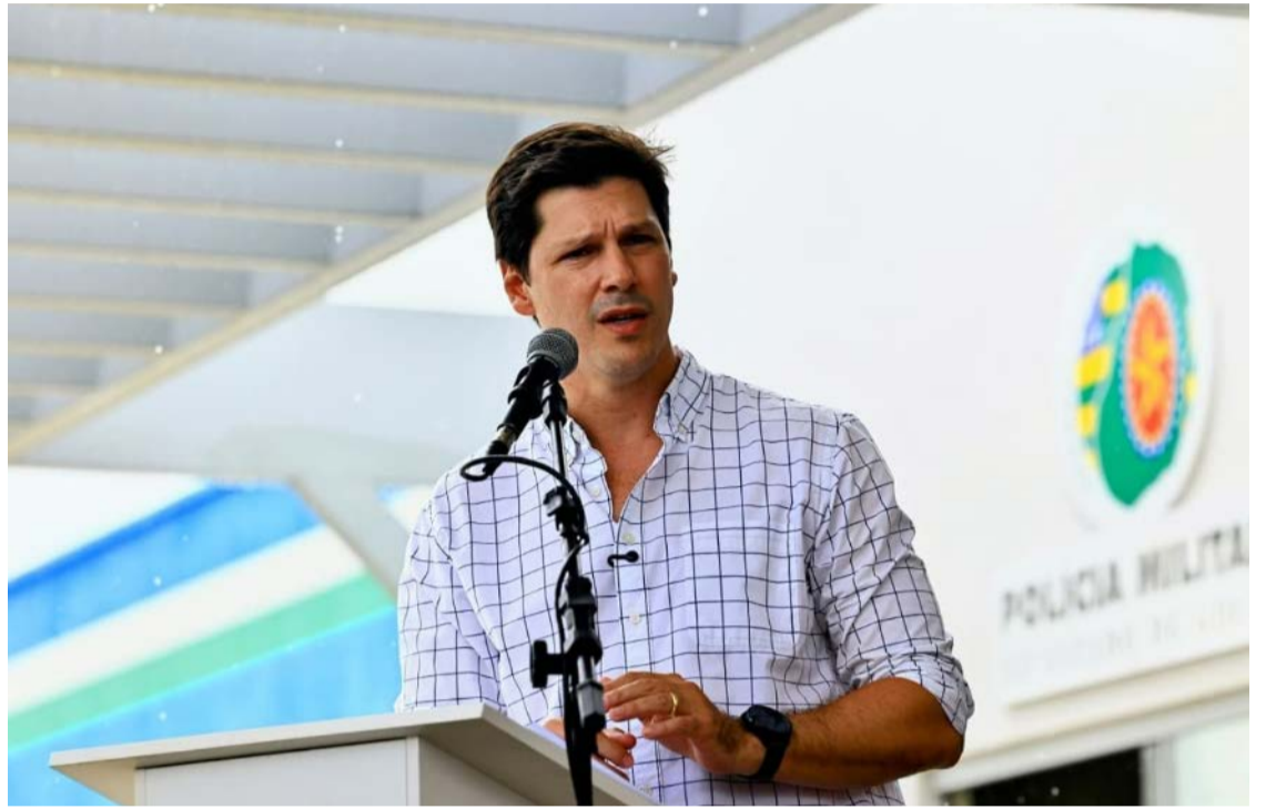
Governador Daniel Vilela reforça compromisso de manter Goiás como referência nacional em segurança pública

Um dos pilares da nova fase será o uso intensivo de tecnologia. O governo aposta na ampliação de ferramentas de inteligência artificial no combate ao crime, incluindo sistemas de monitoramento e análise de dados em tempo real. Em eventos recentes, Vilela destacou que Goiás se tornou re-