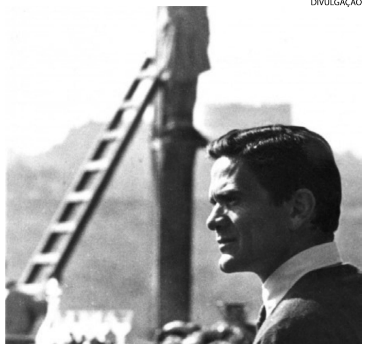
Pier Paolo Pasolini foi intelectual de expressão na Itália