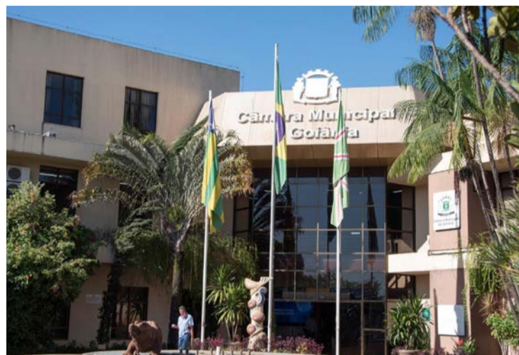
Câmara Municipal de Goiânia solicitou investigação ao MP-GO

Investigação apura denúncia no concurso público para a Câmara Municipal de Goiânia