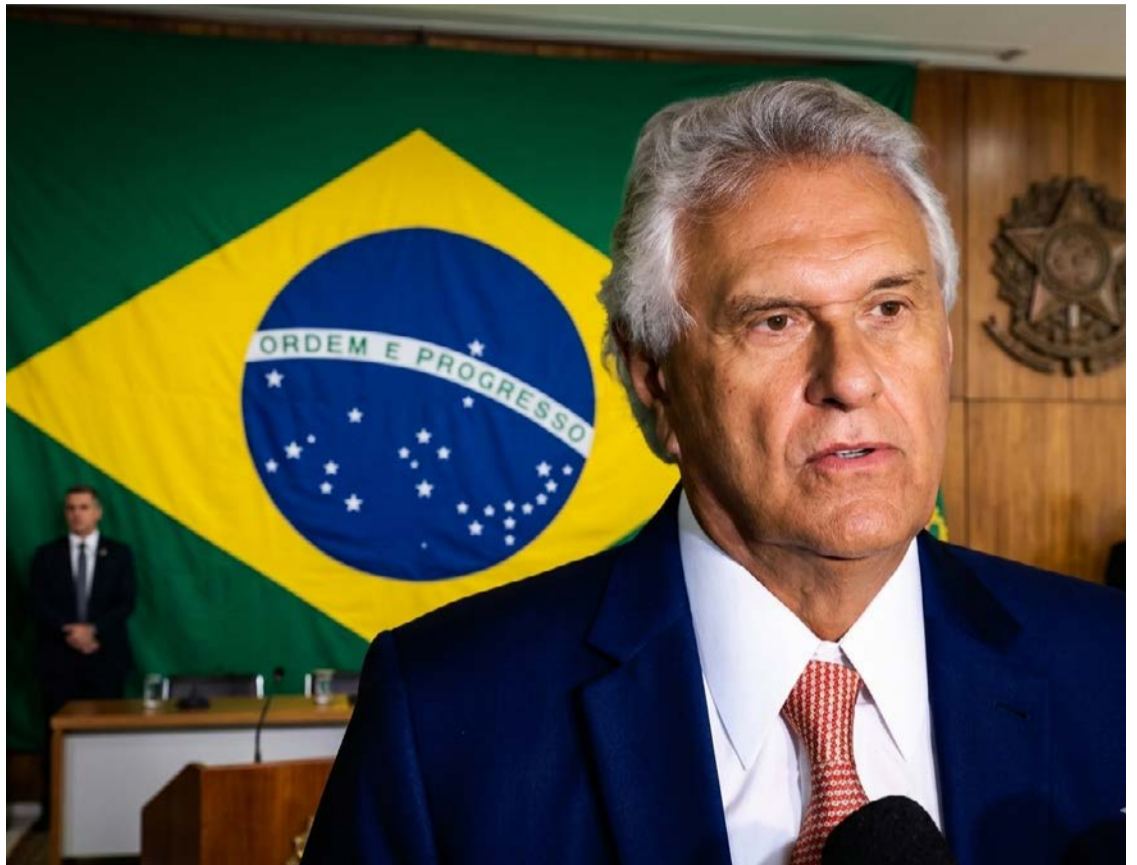
Ex-governador Ronaldo Caiado articula para ter apoio do União Brasil nas eleições

O presidenciável reforça que sua saída não foi motivada por rupturas internas, mas por uma divergência tática quanto à viabilidade de uma candidatura majoritária. Ao buscar o União, Caiado tenta resgatar a base histórica que o acompanhou desde os tempos de PFL e Democratas, visando consolidar um bloco de centro-direita robusto o suficiente para enfrentar a polarização nacional.