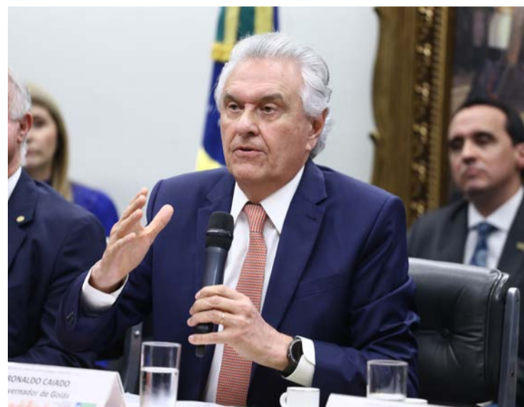
Ex-governador Ronaldo Caiado opta por São Paulo no lugar de Brasília

Escolha marca estratégia diferente da adotada por Lula e Flávio, que optaram por bases em Brasília