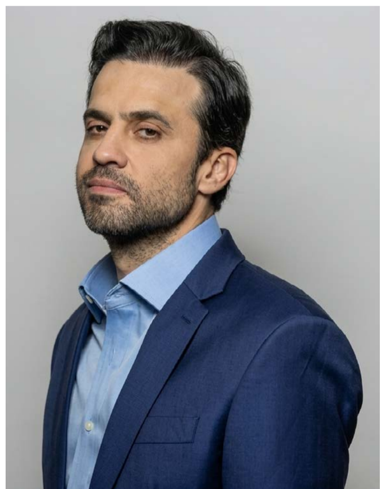
O goiano Pablo Marçal promete ajuda à campanha de Bolsonaro este ano

Questionado sobre episódios controversos, como o caso do laudo falso envolvendo Guilherme Boulos em São Paulo, manteve a linha pragmática. “Acredito que muita coisa de eleição é guerra. Eu acho que foi necessário”, afirmou. E reforçou: “Pelo povo vale tudo. Para tirar essa corja de políticos, às vezes vale um prejuízo menor para um bem maior. Vale tomar um processo, ser perseguido, ser destruído nas redes sociais”.