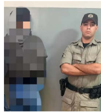
Ação contou com apoio da Polícia Militar após o relato da vítima

O suspeito seguiu para a Delegacia Especializada