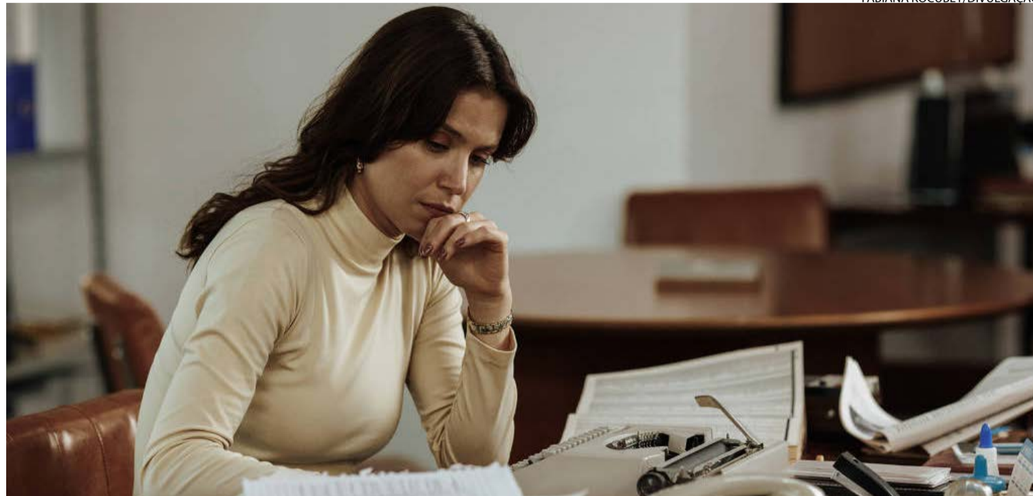
Mistérios: trama acompanha a personagem Silvana enquanto conecta mortes de dois ex-presidentes do Brasil