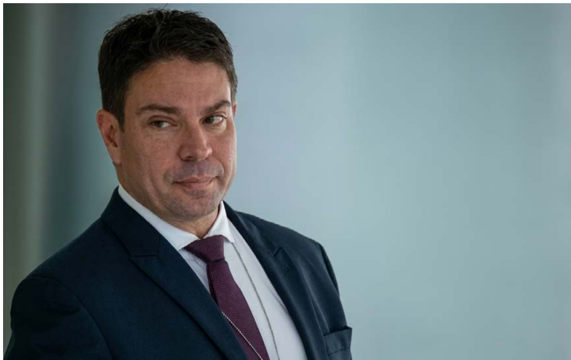
Alexandre Ramagem, próximo da família Bolsonaro, foi preso nos EUA

Ramagem teria se mudado em setembro para um condomínio de luxo na Flórida, enquanto gravava vídeos e votava à distância nas sessões da Câmara, amparado por um atestado médico.