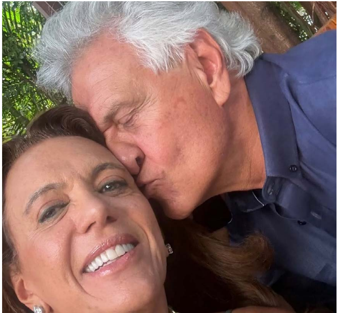
Ronaldo Caiado e Gracinha participam de série "Antes da Faixa", que visa humanizar pré-candidatos