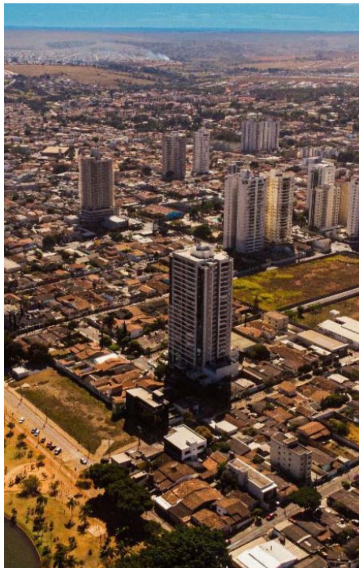
Moradores de Anápolis terão até o dia 30 de abril para realizar o pagamento

A prefeitura também oferece o programa "Adote um Espaço Público", com descontos de até 100% no IPTU e Issqn.