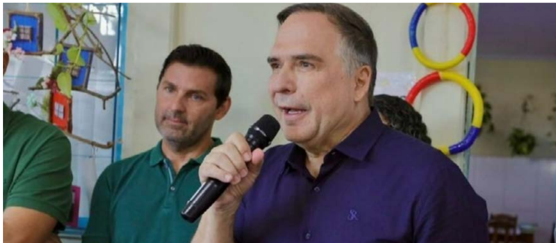
Sandro Mabel anuncia reajuste: 5,4% será aplicado na folha de maio dos professores