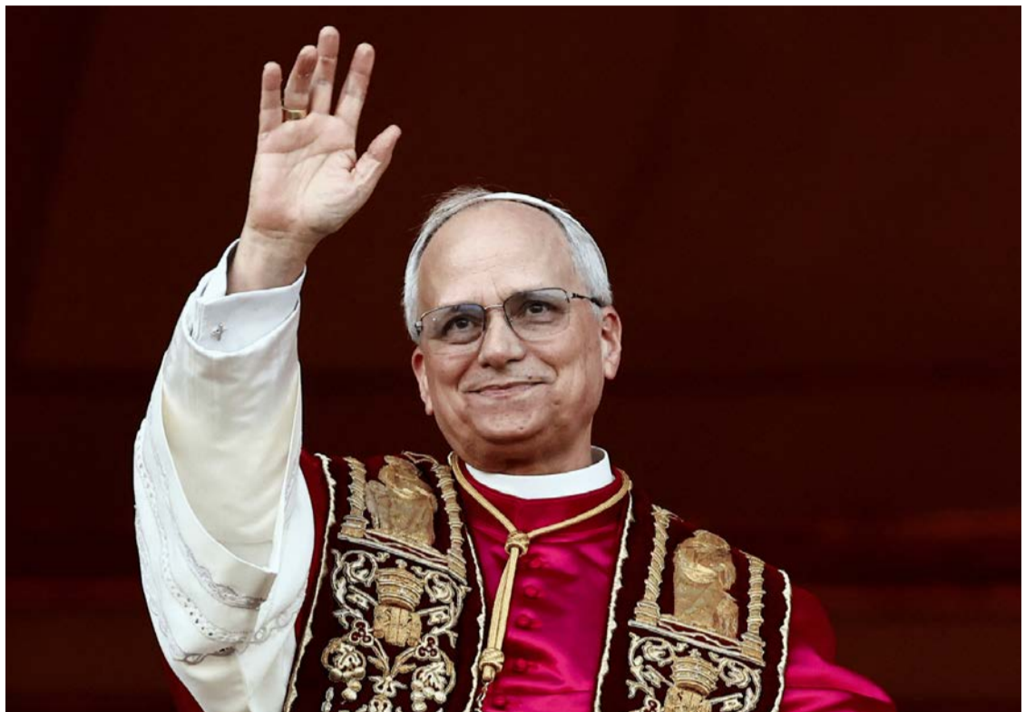
Papa Leão 14: "Não tenho medo da administração Trump. Vou continuar a falar em voz alta da mensagem do Evangelho"

O presidente disse ainda que Leão 14 deveria ser grato por, segundo ele, ter sido escolhido como papa somente por ter nascido nos EUA. "Eles [a Igreja] acharam que seria o me-