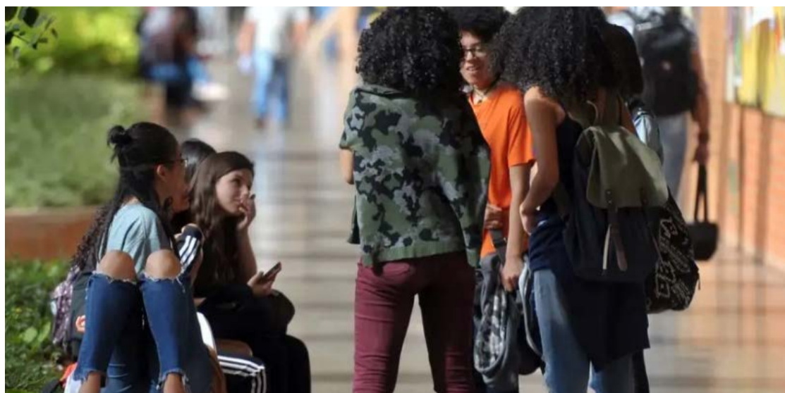
Políticas de cotas ampliam acesso e elevam taxa de diplomação no ensino superior federal

A pesquisa, contudo, não explica o que leva ao índice menor dos estudantes de ampla concorrência, uma vez que eles não são contemplados com as políticas sociais. Uma das hipóteses seria de que o