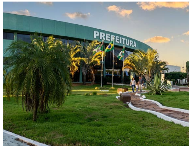
Fachada da Prefeitura de Alto Horizonte que suspendeu pregão por sobrepreço

Secretaria de Compras reconheceu distorções em ao menos 100 produtos de alto consumo